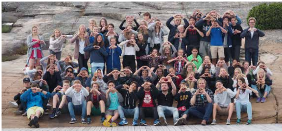
Konfirmantleir på Tjellholmen – Vi lager hjerter med hendene.