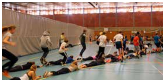
Linjekveld med konfirmanter.