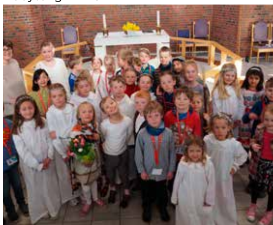
Tårnagentene medvirket i påsegudstjenesten.