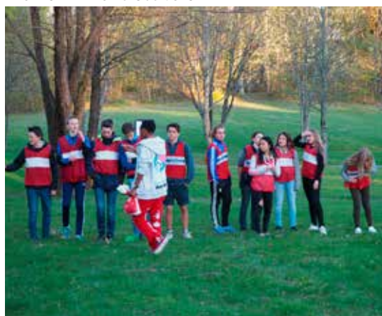
Linjekveld med konfirmanter.