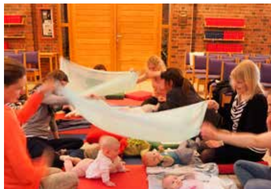
Babysang i kirken