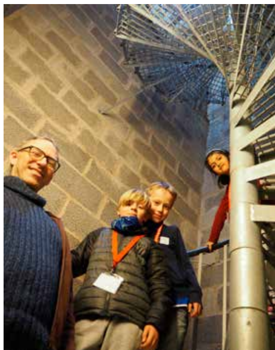
Høydepunkt for tårnagentene var tårnvandring.