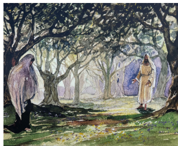
3. JESUS VISER SEG FOR MARIA MAGDALENA

Det samme snudde hun seg og så Jesus stå der, men hun skjønte ikke at det var han. Hvorfor gråter du, kvinne? spør Jesus. «Hvem leter du etter?» Hun trodde at det var gartneren, og sa til ham: «Herre, hvis du har tatt ham bort, så si meg hvor du har lagt ham, så skal jeg ta ham med meg.» «Maria», sa Jesus. Da snudde hun seg og sa til ham på hebraisk: «Rabbuni» – det betyr mester. Jesus sier til henne: «Rør meg ikke, for jeg har ennå ikke steget opp til Far. Men gå til mine brødre og si til dem at jeg stiger opp til ham som er min Far og Far for dere, min Gud og deres Gud.» Da gikk Maria Magdalena av sted og sa til disiplene: «Jeg har sett Herren!» Og hun fortalte hva hun hadde sagt til henne.