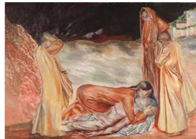
Henrik Sørensen: Pieta