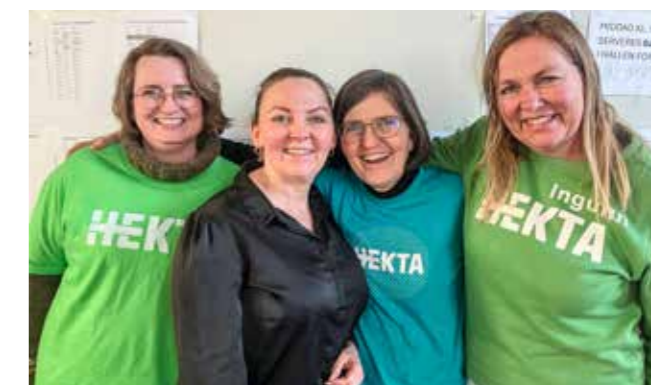
Frivillige hjelpere fra våre menigheter: