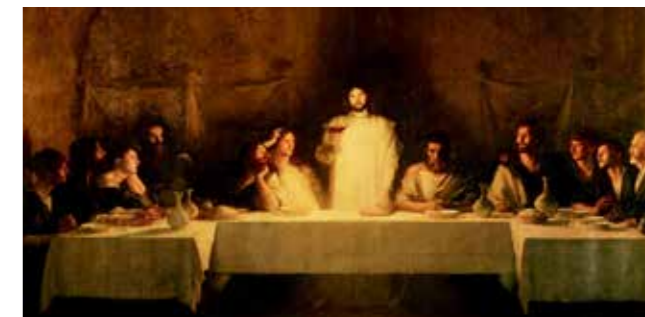
Pascal Dagnan-Bouveret: Det siste måltid