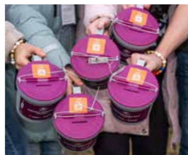
Ta godt imot ungdommene som kommer!