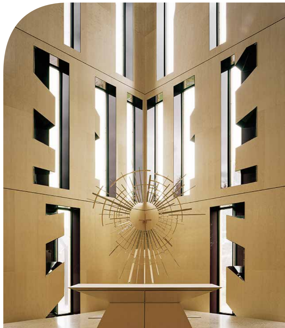
Nye Våler kirke feirer 10 år i år og er en såkalt oppstandelseskirke. Her finner vi det enkle korset omkranset av lyset.

Kvinnene skunda seg bort frå grava, redde, men jublande glade», fortel Matteus, og dei sprang for å fortelje det til disiplane. Det er dette todelte av redsel og glede eg vil stanse litt ved. Det er jo dette som er verkeleg. Men ei ny verkelegheit bryt gjennom. Og den rørsle ho skapar, er også vår verkelegheit. Trua på oppstoda blir ei drivkraft til håp og kjærleik. Denne drivkrafta gjer at vi – midt i alt som er – faktisk kan tru på Guds kjærlege nærvær. Fordi det har brote gjennom, i Jesu oppstode.