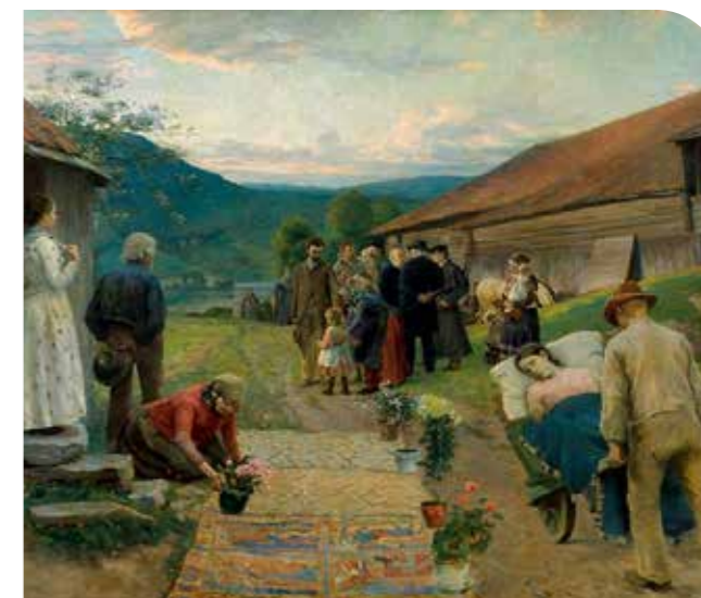
Christian Skredsvig: Menneskets sønn

Vi feirer Jesu oppstandelse fra de døde.