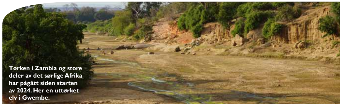
Tørken i Zambia og store deler av det sørlige Afrika har pågått siden starten av 2024. Her en uttørket elv i Gwembe.