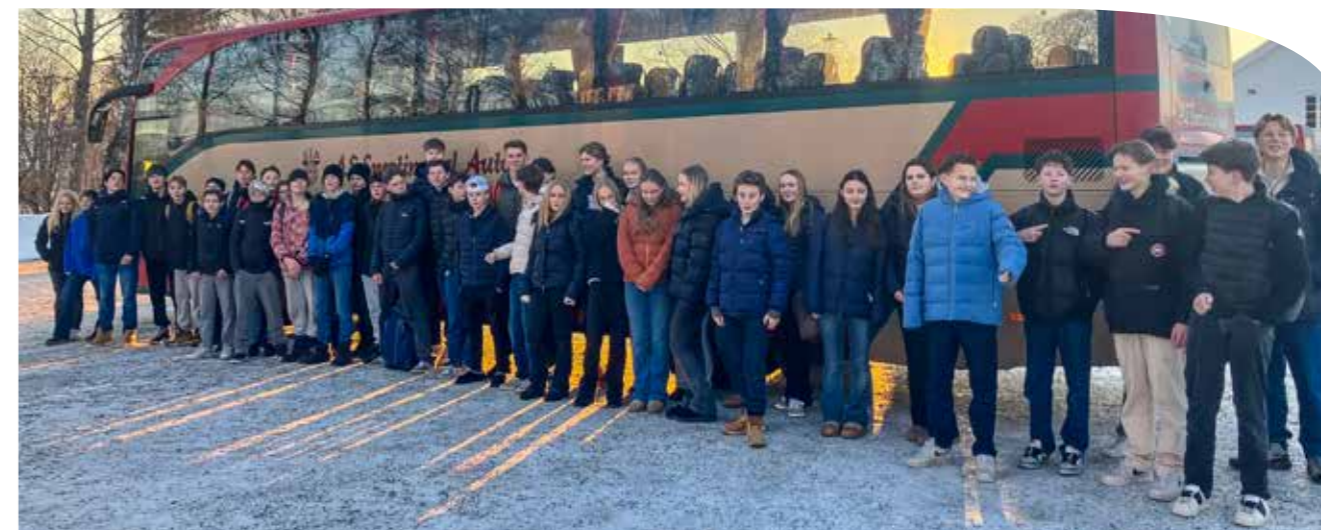
Konfirmantene fra Hoff, Kapp og Nordlien menigheter på vei til leir.