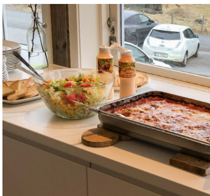
Lasagne står menyen denne dagen