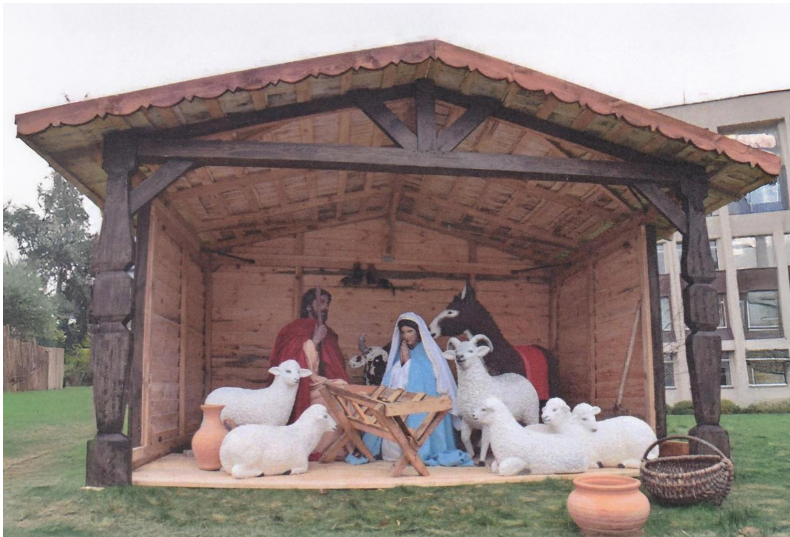
Ei av julekrubbene i Marija sin heimby Marijampole som det er vanleg å besøkje i løpet av juledagane.

i Noreg, å dela ut gåver på julaftan, men enkelte gjer dette på 1. juledag.