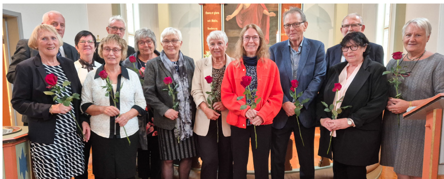
60-årskonfirmantane i Kausland kyrkje