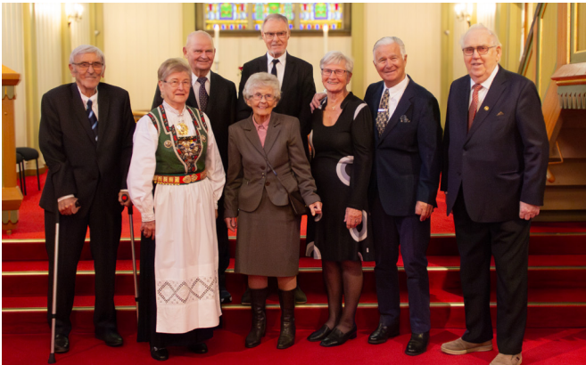
70-årskonfirmantane vart konfirmerte i 1954