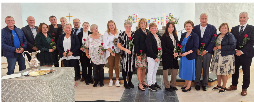
50-årskonfirmantane i Sund kyrkje