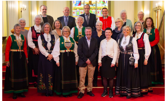
Ein god gjeng med 50-årskonfirmantar, som vart konfirmerte i 1974