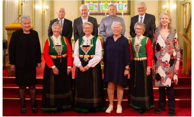
I 1964 vart 60-årskonfirmantane konfirmerte