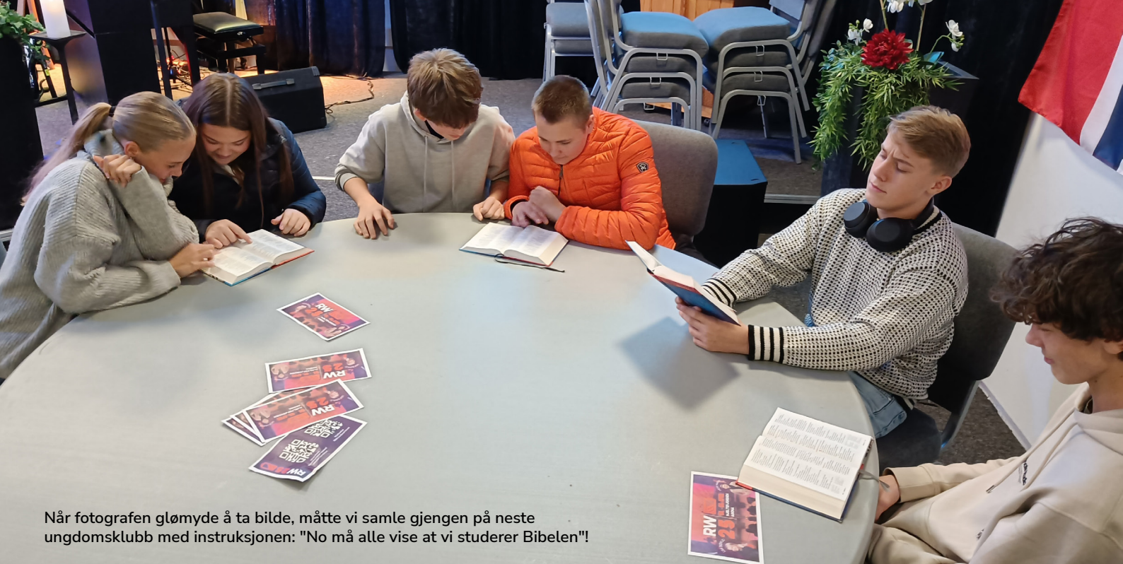
Når fotografen gløymde å ta bilde, måtte vi samle gjengen på neste ungdomsklubb med instruksjonen: "No må alle vise at vi studerer Bibelen!"