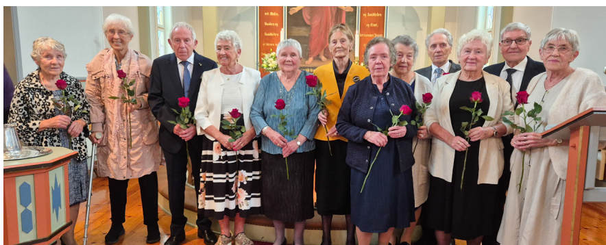
70-årskonfirmantane i Kausland kyrkje