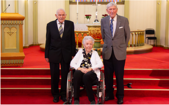
75-årskonfirmantane saman med 80-årskonfirmanten (i midten)