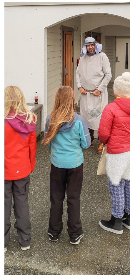
Borna fekk blant anna møte Abraham

Det vart altså litt leir likevel i november, men både leidarar og deltakarar håpar på «vanlege» leirar på Skjergardsheimen når vi kjem til våren igjen!