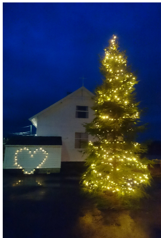
Lysa minner oss om kven som er verda sitt lys. Hjarta - ha omsorg for kvarandre i ei krevjande tid! Foto: Normann Martinussen, tekst: Bjarne Skjold

Julegrana utafør Nautnes Bedehus vart tent 1. søndag i advent!