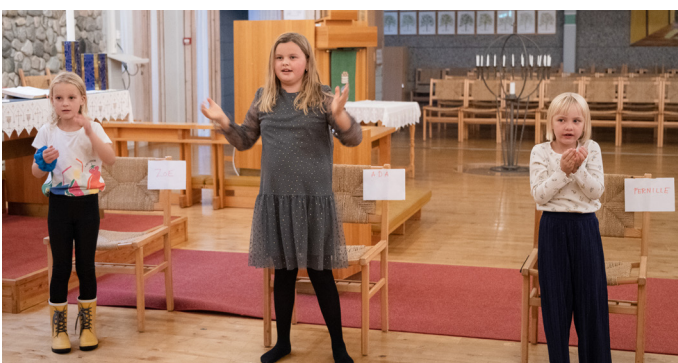
➤ Glimt frå ei korøving SIDE 10