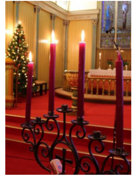
Det vert innspeling av gudsteneste for skulane, med innspel frå ulike skular og kyrkjer.