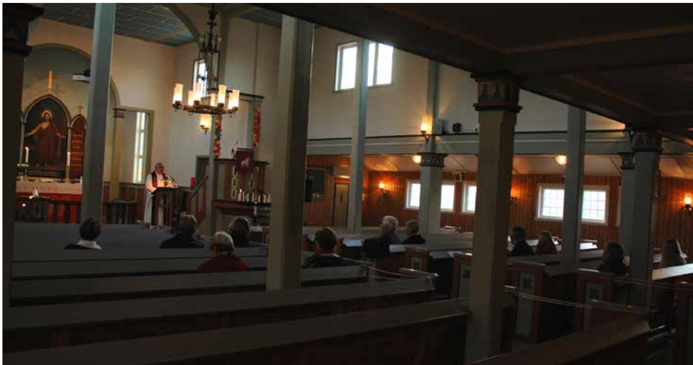
Under koronaen har det ofte vore langt mellom dei som har kunna møte fram til gudsteneste.