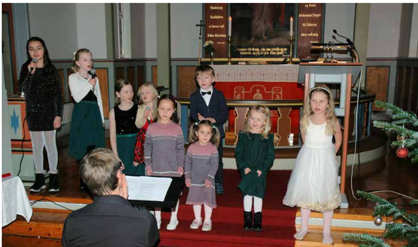
Saman song Stjernekorret og Betweenskorret både «Julekveldsvise» og «Under stjernene».