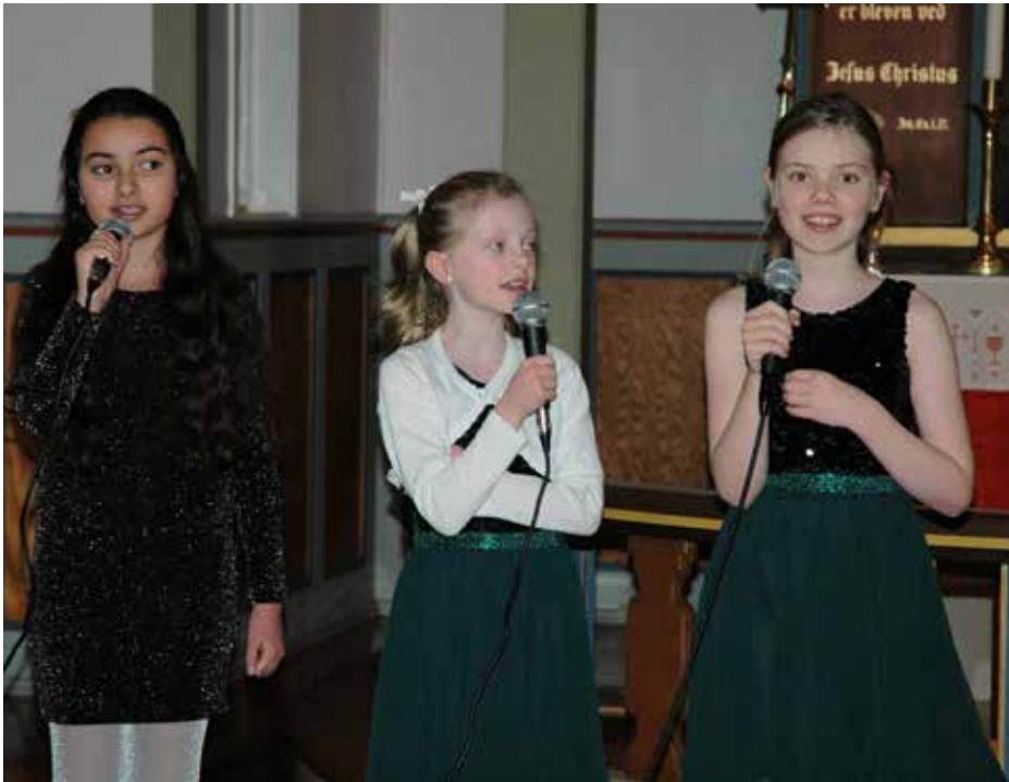
Berre tre av medlemene i Betweenskoeret var til stades, men med kvar sin mikrofon bar songen fint når dei framførte «Nå er den hellige time».

Siste søndagen før jul samlast ein i Kausland kyrkje, dei det var plass til, for å syngja jula inn. Sjølv sagt vart det mykje song på ein kveld som dette, både av dei to barnekoera og av resten av kyrkjelyden.