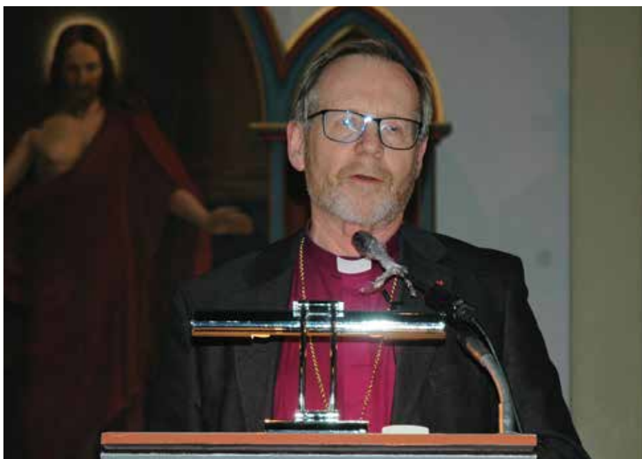
Biskop Halvor Nordhaug heldt føredrag på kulturkvelden.

Bjørgvin bispestol, 8. november 2020 Halvor Nordhaug