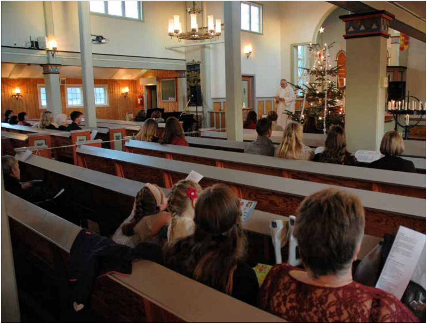
Det var ikkje plass til så mange i kyrkja på julaftangudstenestene i 2020. Her ser vi ei spreidd forsamling frå julaftangudstenesta i Kausland kyrkje.