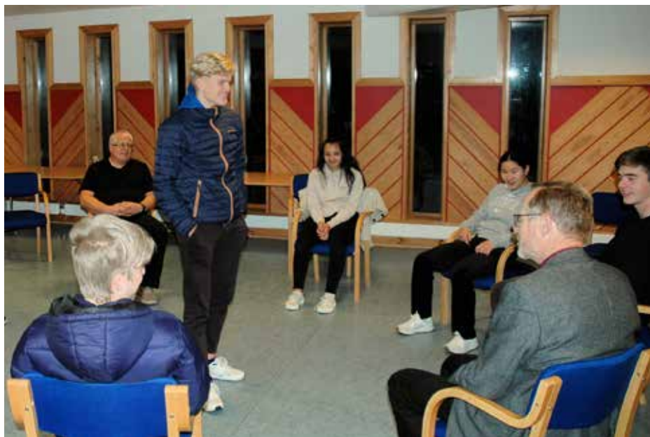
Biskopen besøkte ungdomsmiljøet Boost og var der med på ein lek.

Når ein skal byggja kyrkjelyd gjennom å feira gudsteneste må ein stadig arbeida for at dei kan bli attraktive og relevante for folket i Sund. Då er det fint å ha eit gudstenesteutval som kan vera med å førebu gudstenesta saman med kantor og prest, og som også kan gjere teneste som