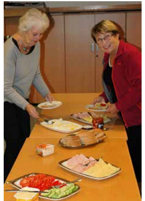
Skiver og pålegg av ulikt slag høyrer med på lunsjbordet på føremiddagstreffa.