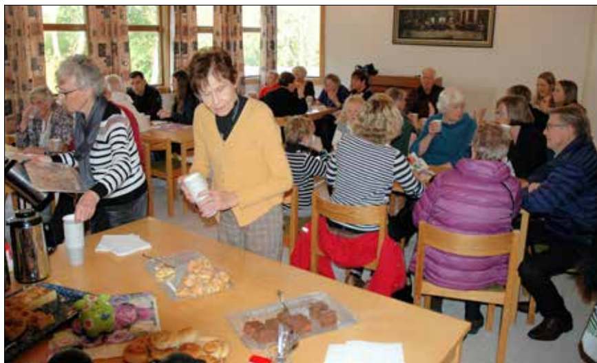
Nokre måtte sørga for nye forsyningar medan andre kunne sitja og prata saman.