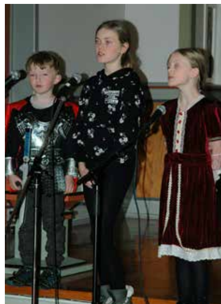
Det var ikkje så mange frå Betweeneskoret som kunne vera med denne kvelden, men med hjelp av mikrofonar bar songen fint utover sjølv med få songarar.