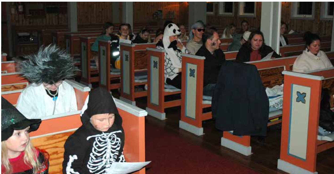
Mange av dei som var på «HalloVenn»-ungdomsgudstenesta hadde teke på seg artige kostyme.