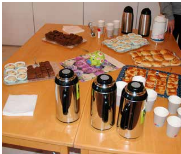
Det var mykje godt å velja blant.