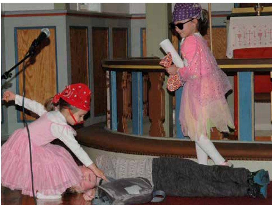
Bibelteksten vart illustrert etter kvart som han vart lesen opp.