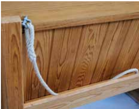
Tauga som stengde av benkar var tekne ned.