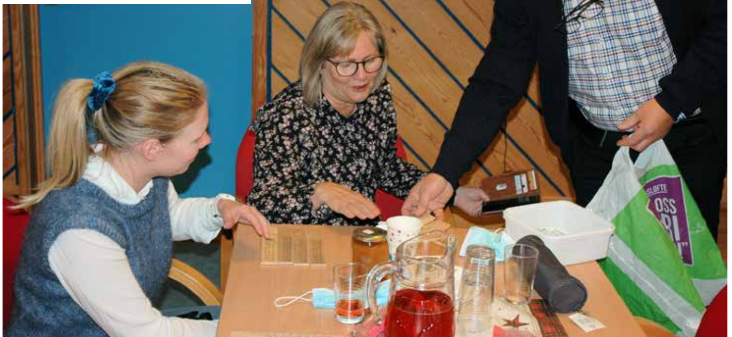
Her gjeld det å sikra seg nokre årar som ein kunne bruka i to trekningar.