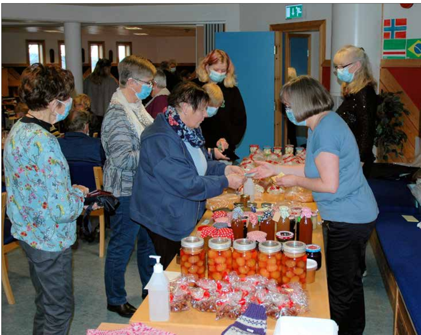
Mange nytta høvet og fekk kjøpte med seg noko av det som vart selt denne dagen.