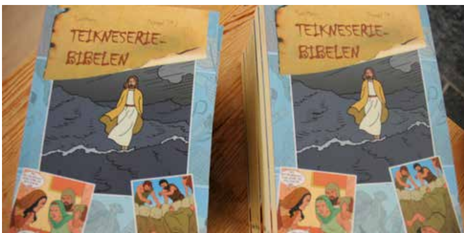
Teikneseriebibelen inneheld ein del fortellingar frå Bibelen, men i teikneserieformat.