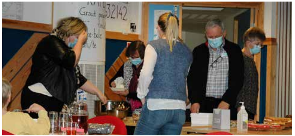
I kaféen var det både graut og kaffi og kaker å få kjøpt.