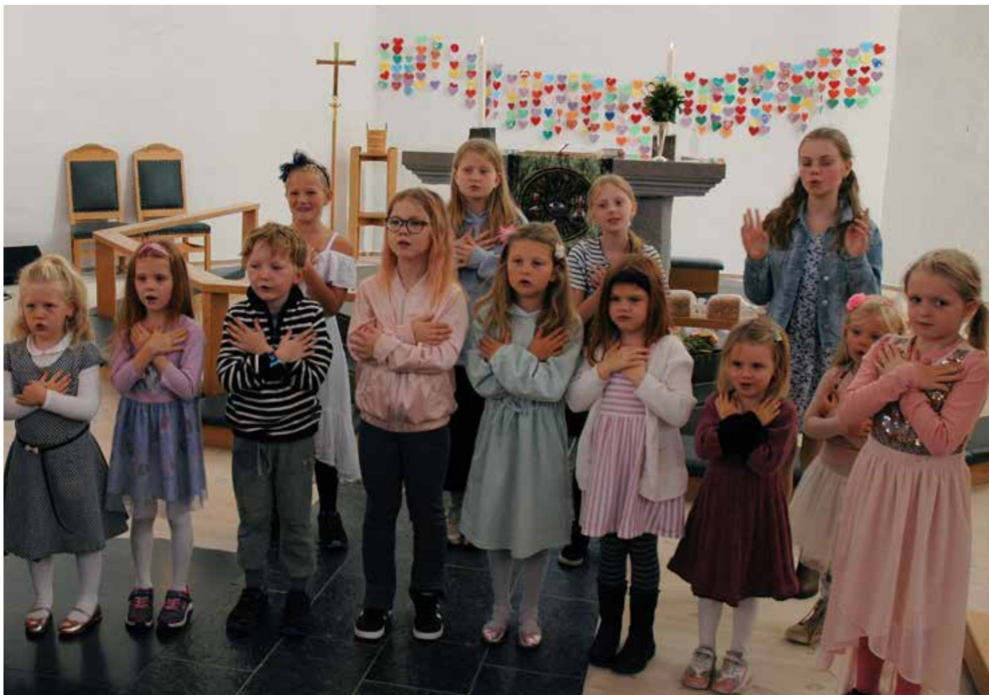
Fin song frå barnekora, med rørsler og det heile.