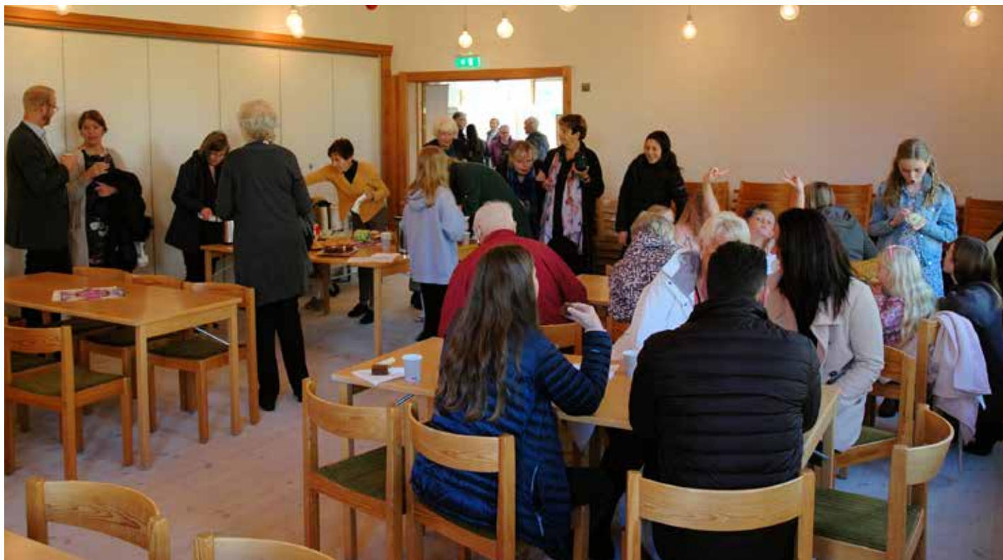
Folk trekte inn i kyrkjelydssalen i Sund kyrkje etter gudstenesta for å vera med på kyrkjekaffien.