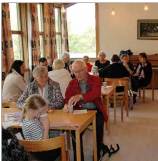
Det sat nokon ved alle borda i kyrkjelydssalen.