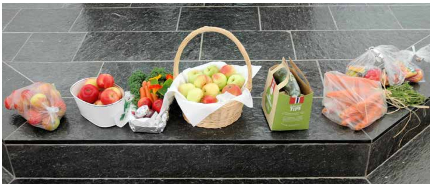
Litt av «markens grøde» var stilt opp framfor altaret.