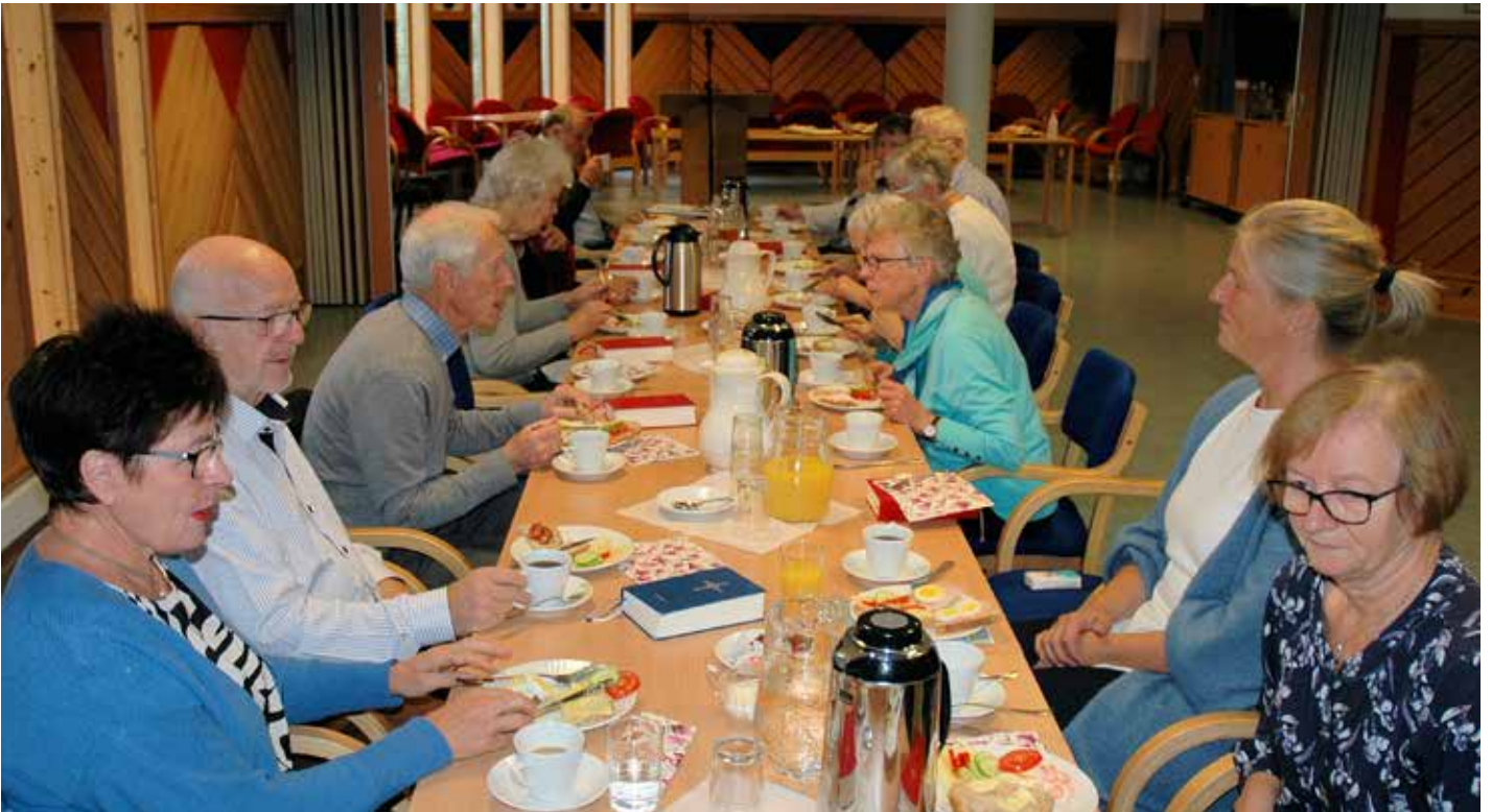
Endeleg samling igjen rundt lunsjbordet på det første føremiddagstreffet på lenge.