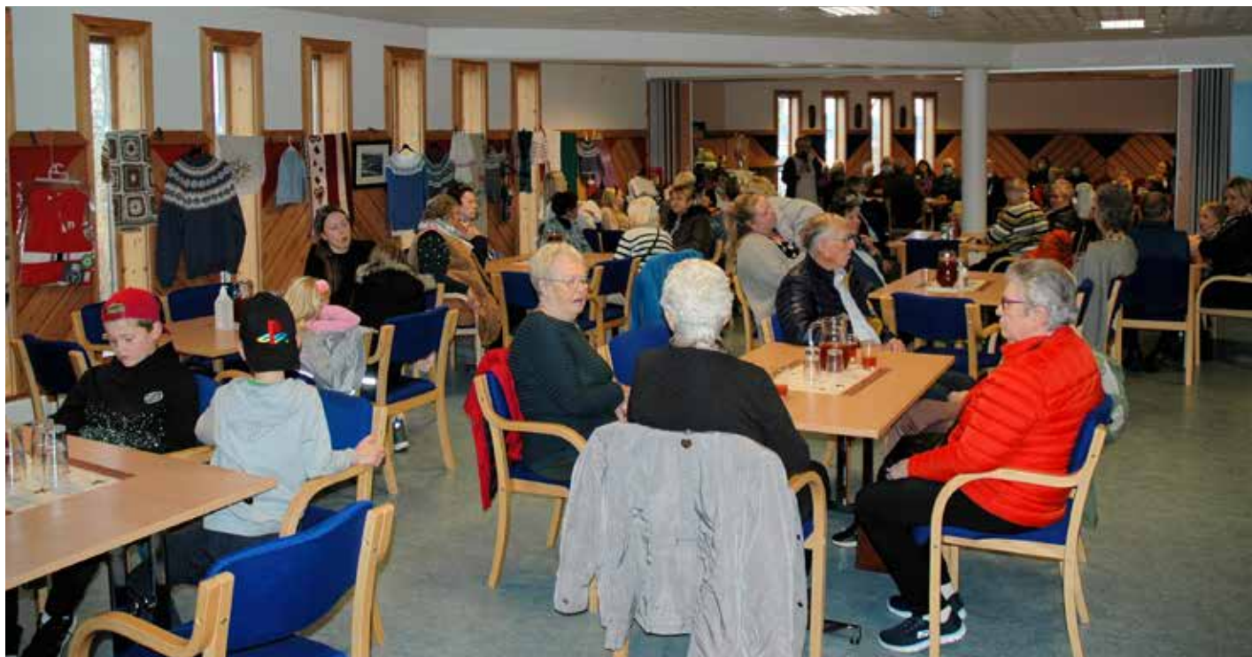
Det var fylt opp rundt borda som var plasserte ut.