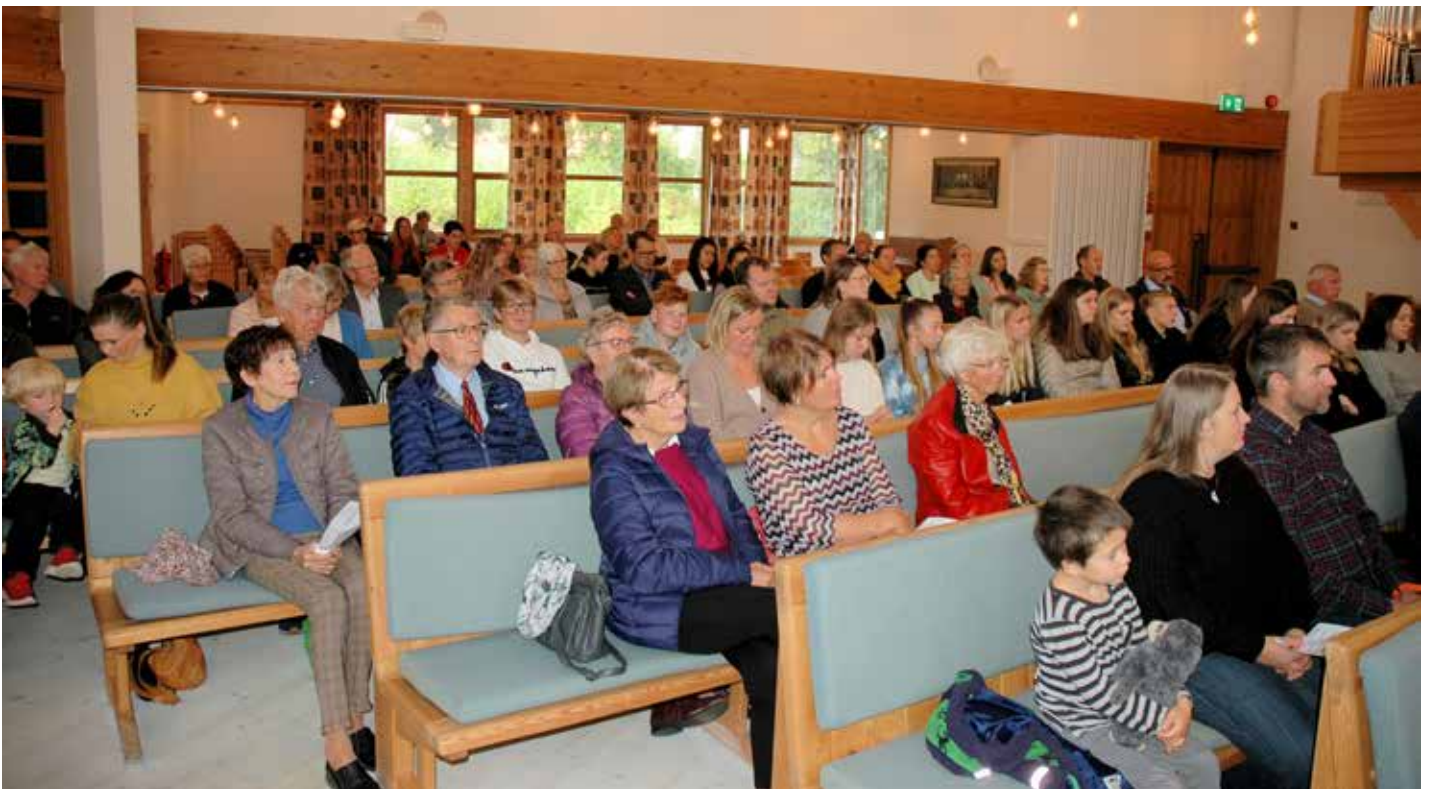
Det er slutt på avgrensingar i kyrkja for kor mange som kan vera til stades. Jamvel kyrkjelydssalen bak i kyrkja var opna opp i den første gudstenesta i Sund kyrkje med full opning.