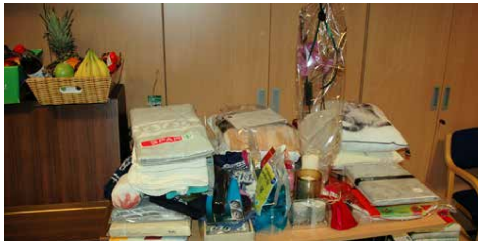
Mange fine premiar stod klar til trekninga på årane.