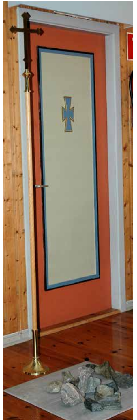
Mange la ned ein stein ved krossen som symbol på ei bør dei ville leggja frå seg.