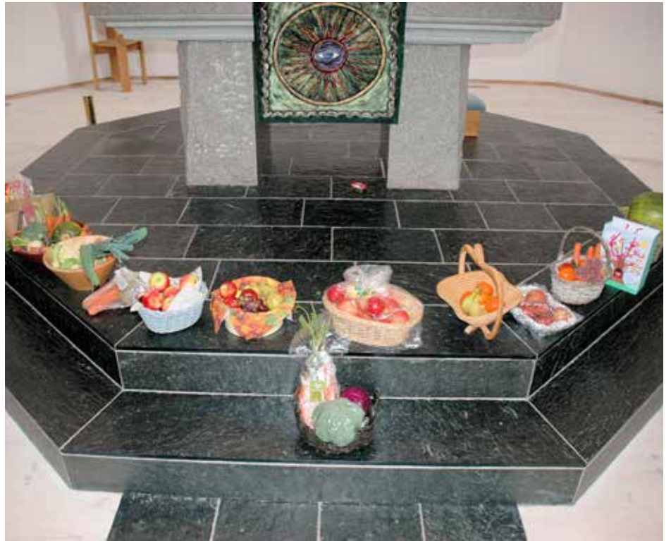
Mange korgar med frukt og grønnsaker samla framme ved altaret som døme på det vi har å takka for på ein hausttakkefest.