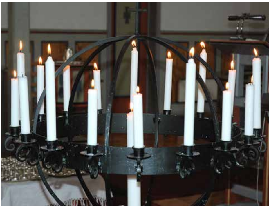
Det vart etter kvart tent mange lys i lysgloben.