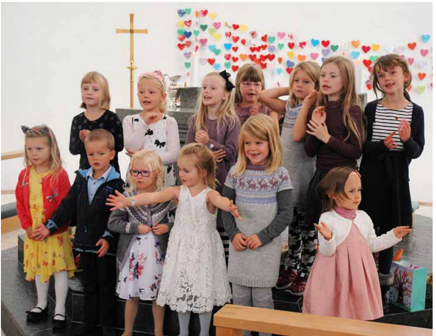
Stjernekorset utgjorde ei stor gruppe som song nokre fine songar for kyrkjelyden.