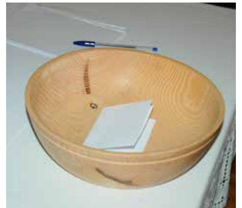
Fleire bønelappar hamna i korga. Etter bønevandringa vart korga bedd for.