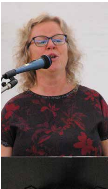
Borghild song for dåpsborna «Jesus er kongen min», ein song ho minst frå sin eigen barndom.