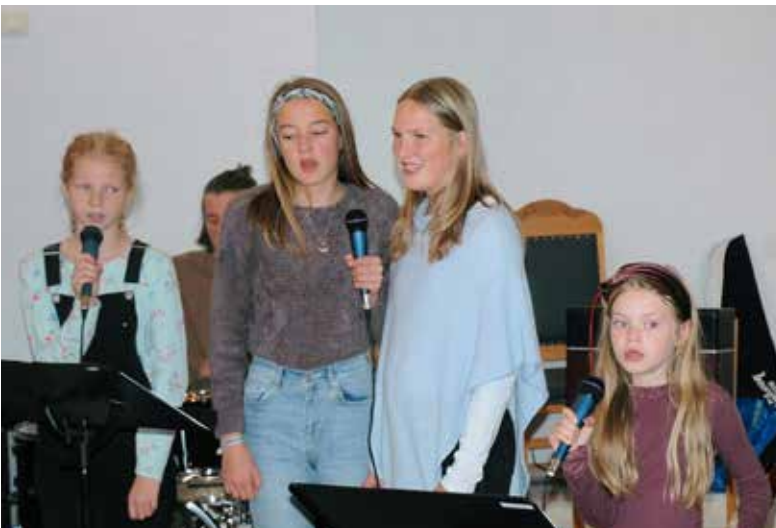
Betweeneskoret song på Lovsongskvelden.