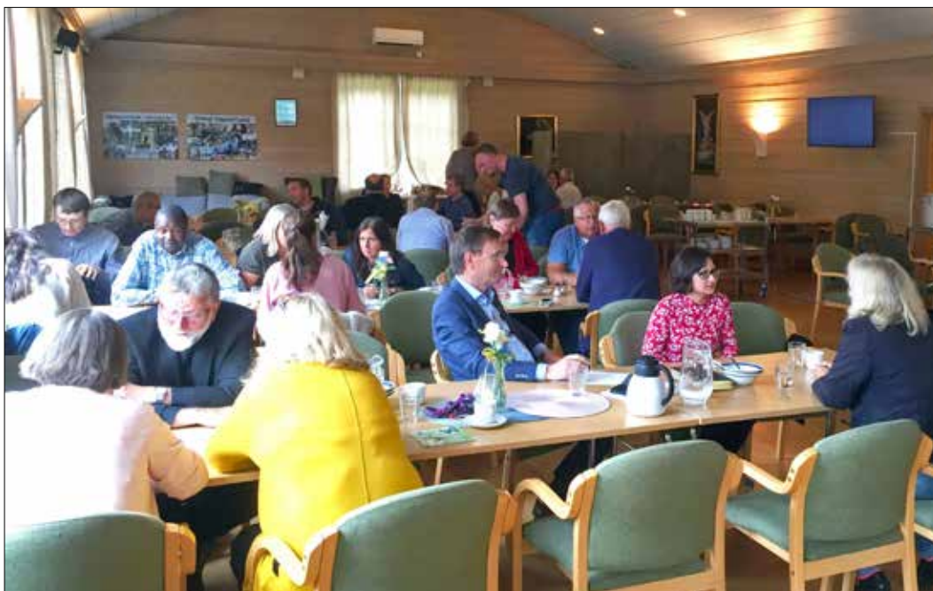
Tilsette frå Fjell, Sund og Øygarden, prost og prestar, er på fellessamling i Fjell kyrkje. Tema rundt borda er visjon og verdiar.

Om vel 1 år, 1.12.2019, skal dei kyrkjelege fellesråda vere slått saman til eitt fellesråd. Det skjer 1 måned før kommunane vert slått saman. Det er lagt opp til ei overgangsordning i desember 2019. Samanslåingsarbeidet som kyrkja driv er i rute, takka vere godt medarbeiderskap.