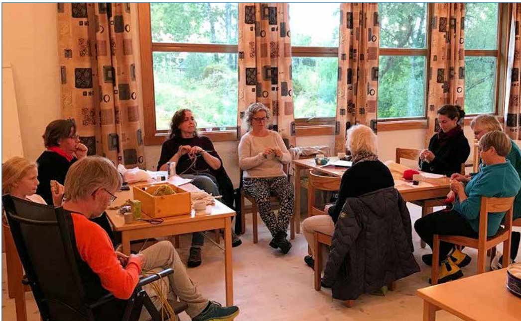
Strikkekafeen møtest i Sund kyrkje annakvar tysdag.

Vi er veldig glade for at vi har fått til eit nytt tilbod i Sund kyrkje i haust. Annakvar tysdag er Sund kyrkje open frå 1730 til 1930. Første gongen vi hadde strikkekafé var 10. september, og vi har vore samla tre tysdagar hittil i haust.