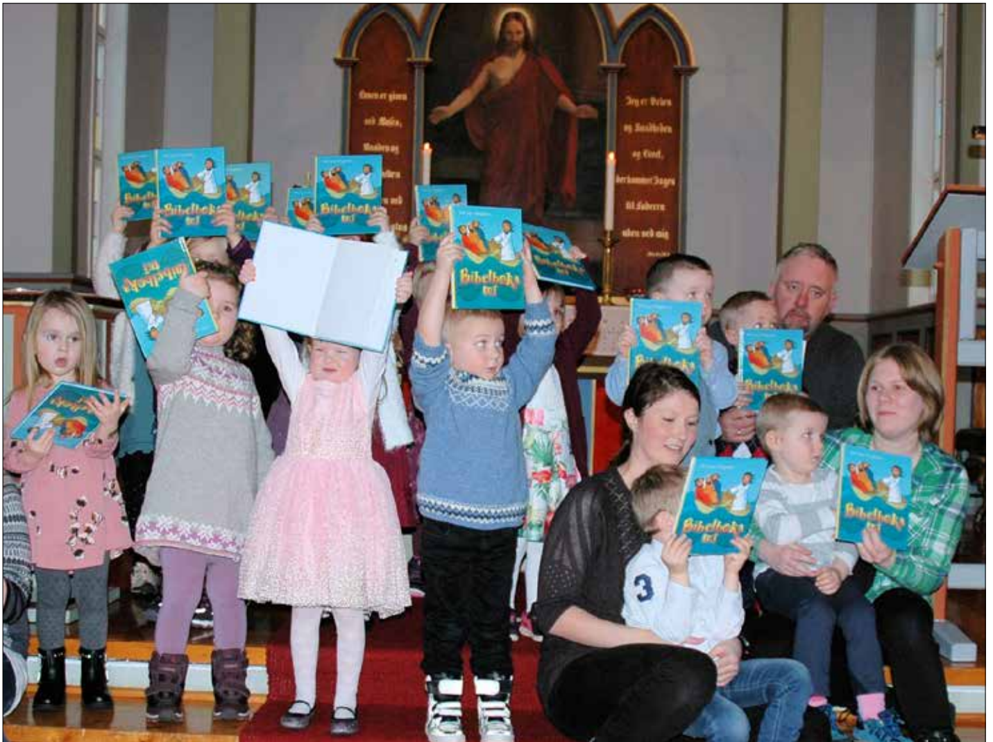
Mange 4-åringar hadde come til Kausland kyrkje då dei skulle få «Bibelboka mi».