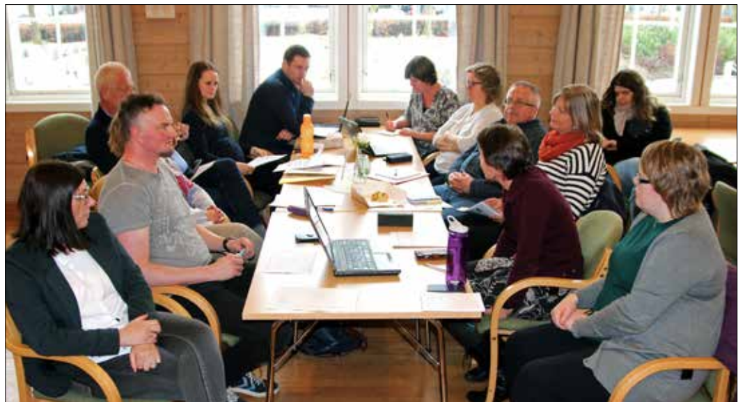
Samanslåing av fellestråd: Gruppeleiarar og gruppesekretærar samla til oppstartsmøte i Fjell kyrkje torsdag 8. mars. Det er oppretta 8 arbeidsgrupper som skal sjå på det ein har og det ein har behov for når ein ny organisasjon skal byggjast. Arbeidsgruppene er sett saman av tilsette frå Fjell, Sund og Øygarden.

Kyrkjer, gravferd og gravplassar, kyrkjemusikk, trusopplæring/samarbeid skule, tweens/konfirmantar/