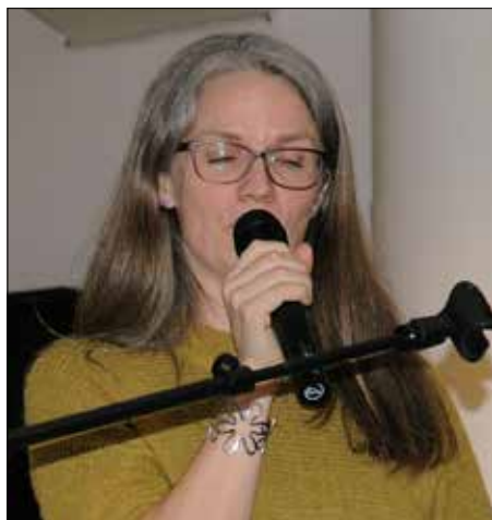
Merete Haukeland song.