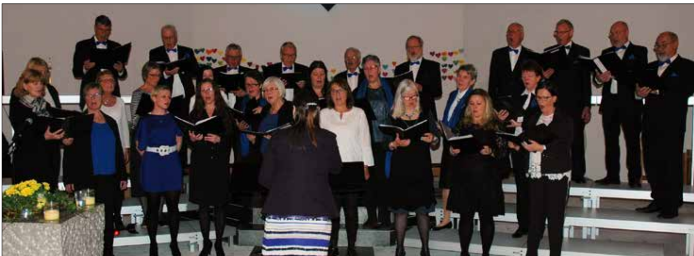
Sund Blandakor stod som arrangør for konserten og hadde songar både på latin, engelsk og tysk.