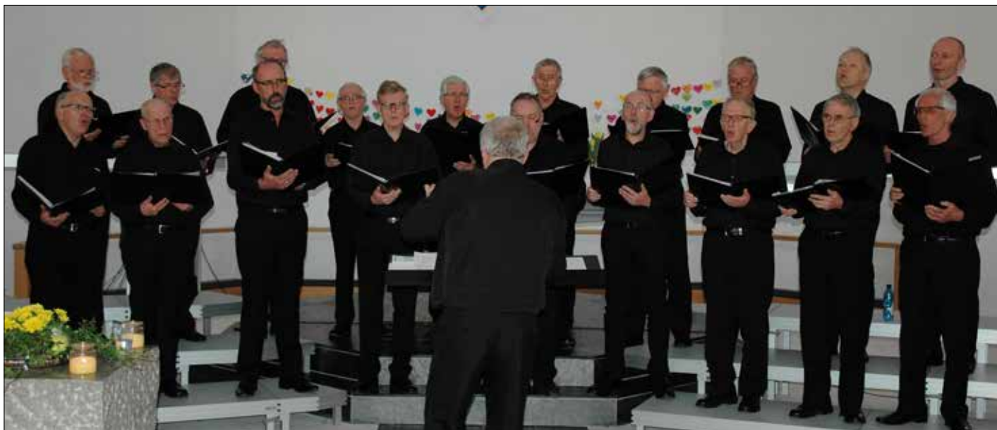
Osternes mannskor frå Stord framførte ei rekke songar som alle hadde folketonar til melodi.