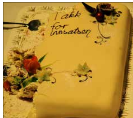
Til slutt var det ingenting att av kaka.