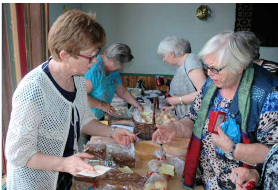
Mange sikra seg nokre av bakarvarene som var til sals.