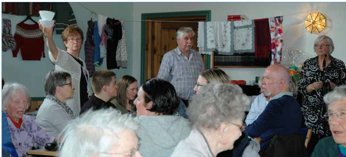
Å trekkja ut vinnarar på to åresal og alle dei selde loddbøkene var godt organisert og gjekk fint unna, sjølv om det var mange gevinstar.