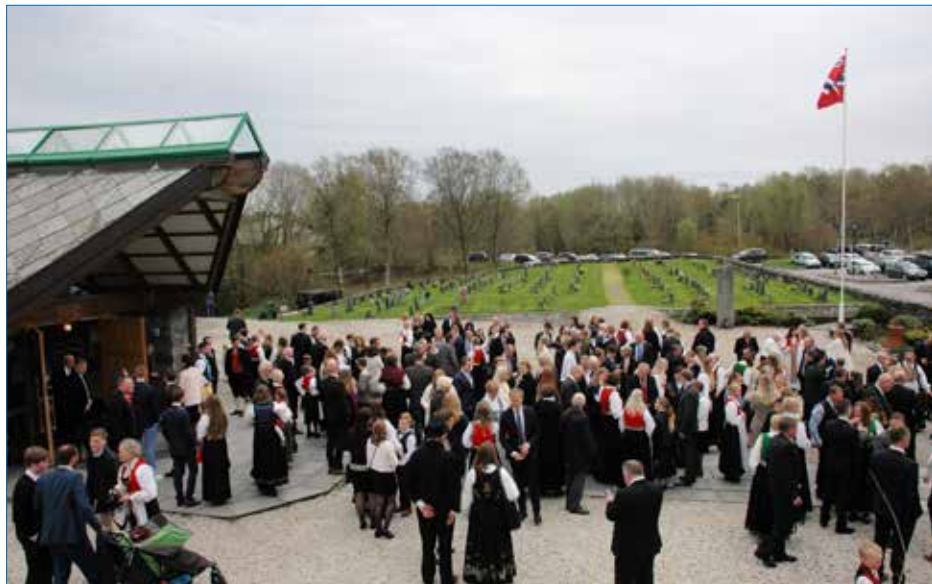
Det var folksamt utanfor kyrkja etter konfirmasjonsgudstenesta.