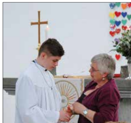
Kvar konfirmant fekk ein kross hengt om halsen.