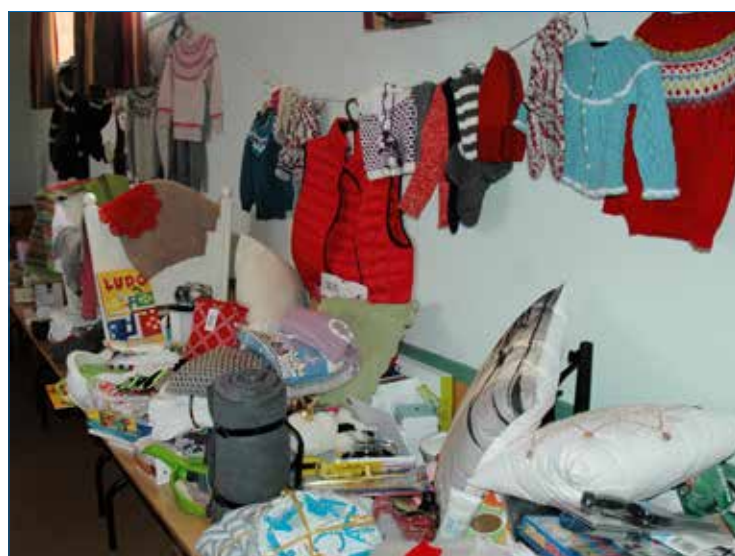
Det var mange gevinstar på denne vårmarknaden.