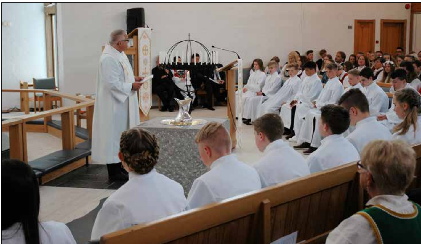
Konfirmantane vart plasserte på fremste benk.