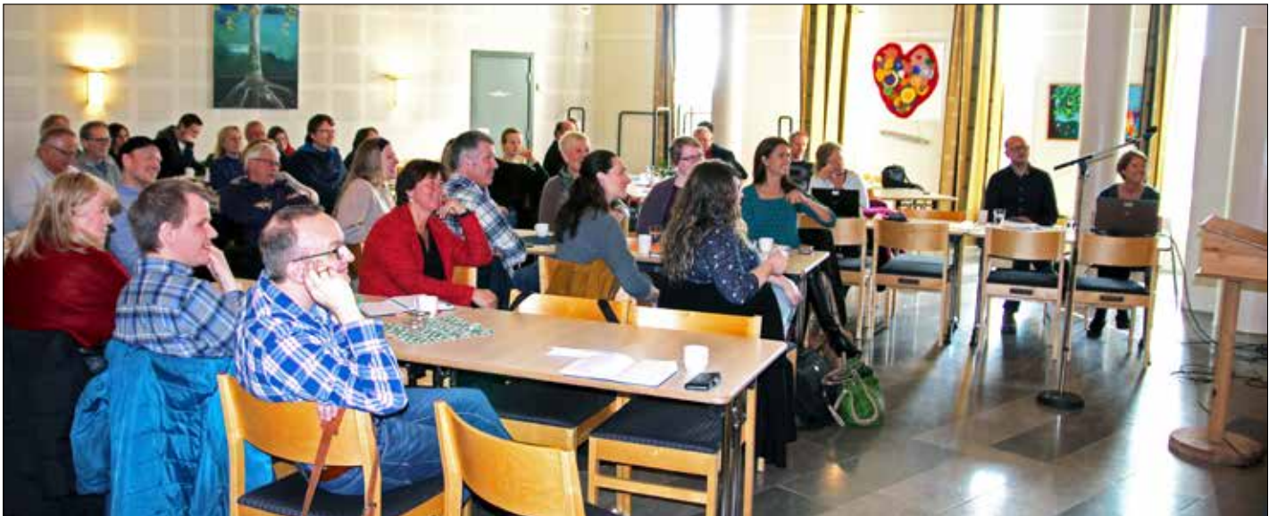
Frå fellessamling i Foldnes kyrkje om etisk refleksjon.