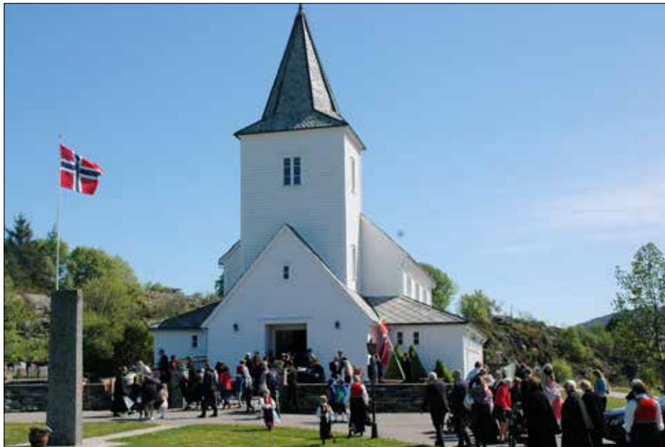
17. mai-toget frå Glesnes skule kjem til Kausland kyrkje.