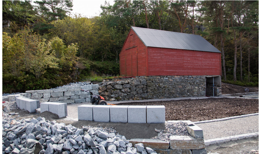
Løa som stod på eigendommen vert tatt vare på, og skal brukast av driftseksjonen.

Norvald Snekkevik , seksjonsleiar for kyrkjer og gravplassar i nye Øygarden kyrkjelege fellelsråd, er letta over at den nye gravplassen snart kan takast i bruk. Det er få ledige graver att på den gamle delen.