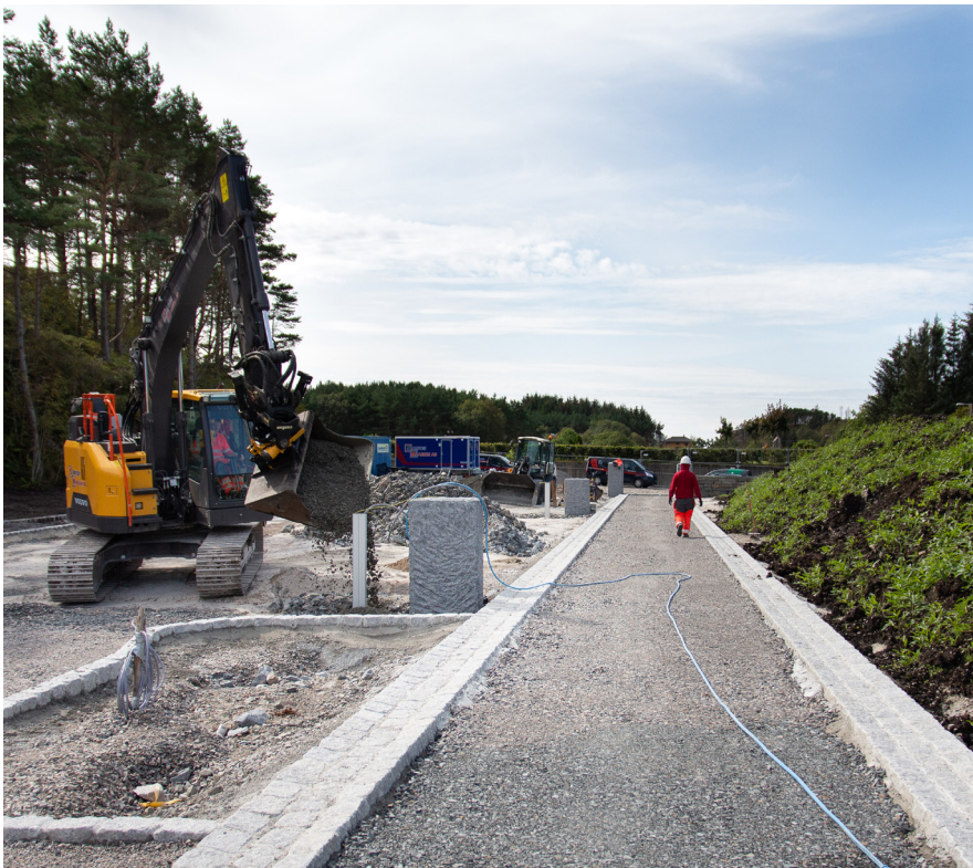
Den nye gravplassen ligg aust for den gamle. Her ser me mot vest, mot den gamle gravplassen.