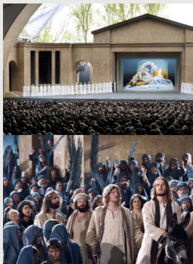
Screenshots frå tidlegare pasjonsspel i Oberammergau.

I snart 400 år har innbyggjarane i den vesle alpelandbyen Oberammergau kvar 10. år framført Pasjonsspelet om Jesu lidning, død og oppstode for millionar av tilskodarar frå heile verda.