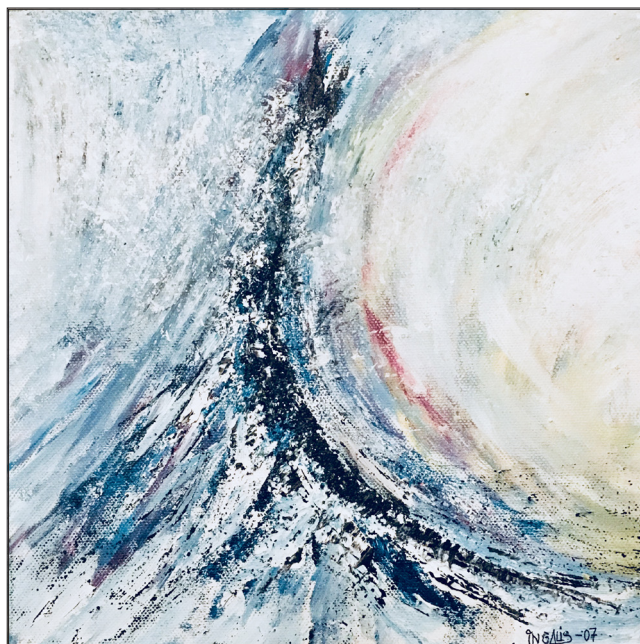
"Livets fjell". Akryl av Ingvald Malmø.

Felles for oss alle er at all bagasje lyt stå att når vi fer. Mobiltelefonen også. Vi fer like tomhendt som vi kom. Det veit vi alle. Kanskje vi i stille stunder bør spørja oss sjølv - kva er det som er viktigast? Eg veit det. Du veit det. Har vi opna gåva og sagt JA til Jesus?