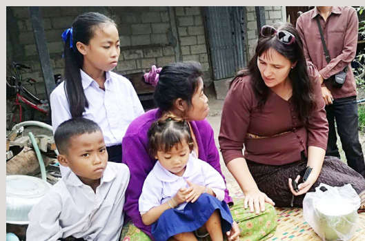
Besøkte School Support i Laos Side 6-7