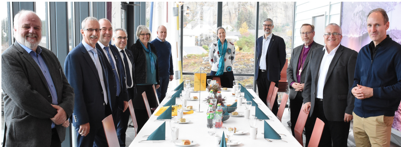
Frå kommunemøtet under bispevisitasen.

Så er det tid for å sjå tilbake på 2020. Men det er også tid for å sjå framover... 2021 blir nok ikkje kvitt 2020 sånn med ein gong, men vi går mot lysare tider på fleire måtar. Og sjølv om vi har lagt bak oss eit «annus horribilis», vil fruktene av arbeidet i Guds rike kome tilsyne også i 2021. Det har vi faktisk Guds løfter om!