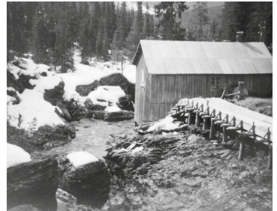
Dale mølle.