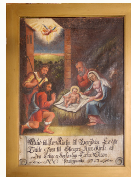
Måla panel frå Skjåk kyrkje

Ordet skapte lyset den morgonen Gud sa: «Det skal bli lys!» Og det vart lys!