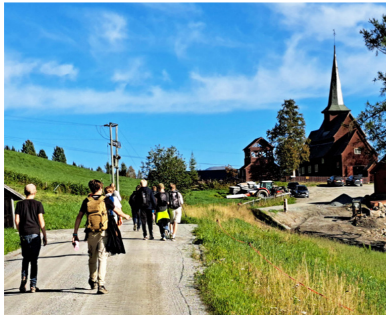
Kva er det å vera konfirmant?