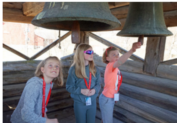
Tårnagenthelg i Volbu