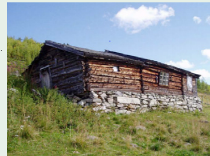
Kristensnlægeret, her er det fjøs og sel i same bygning.

Områda ved Haldorbu og Bøllhaug blei også brukt som læger. Haldorbu er framleis fellesbeite. Ovanfor Bøllhaug er det ei slette som blir kalla marknadsplassen. Her kjøpte og selde dei fe. Dette vart så seint som på 1960-talet brukt som hestehamn.