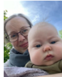
Mens vi ventar på guds-teneste i Nidarosdomen

Korleis vil de ha kyrkja dykkar? Svar på spørsmåla Fellesrådet stiller i dette bladet. Vi vil verkeleg ha innspel. Det er alle dykk vi er til for, og byr vi på heilt andre ting, og på heilt andre måtar enn de ynskjer, er det verd å ta omsyn til. Men gi også gjerne ros for det de er fornøgdde med. Får vi ikkje høyre dei stemmene, kan vi risikere å stake ut ein ny kurs, sjølv om de ynskjer at vi skal halde fram som vi stevner.