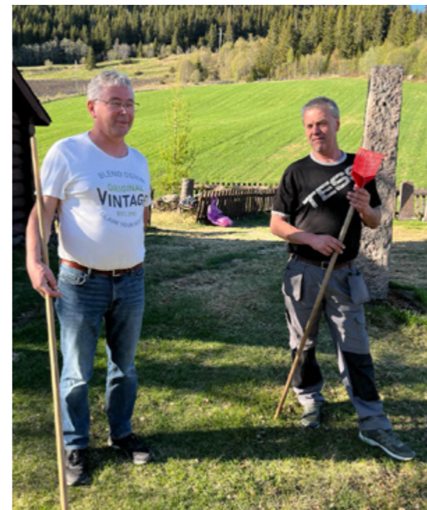
Dugnad ved Hegge.