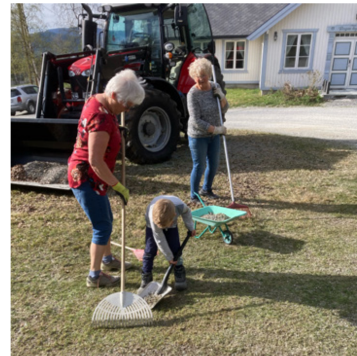
Store og små hjelper til i Rogne.