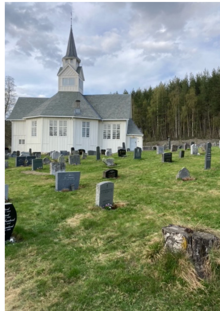
Kyrkjegarden i Rogne

Ved parkeringsplassen på oversida av kyrkja ligg ein bygning med ein etasje og saltak som fungerer som kombinert bårhus og servicehus. Bygningen er teikna av arkitekt M. Røe og vart godkjent i 1967. Ytterveggene er pussa. Gavlane er av bindingsverk som utvendig er kledde med sulagt panel. Inn til bårhuset er det ei tofløya dør. Inngangen er dekkja ved at gavlen er trekt noko ut, understøtta av stolpar på kvar side. Taket er tekt med lappheller. Bårerommet har kvelva himling av tre.