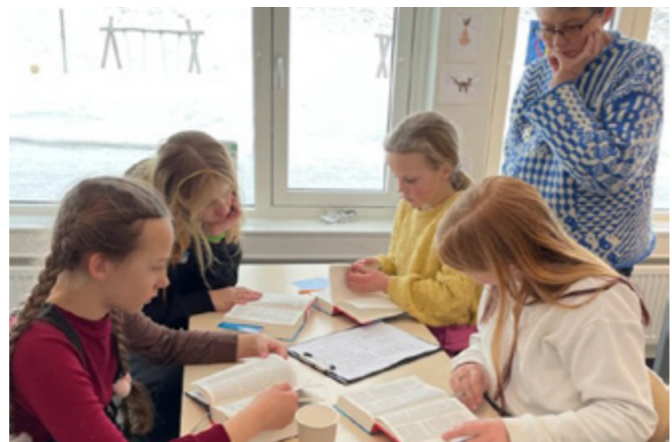
Bibelutdeling ved Lidar skule 19. mars