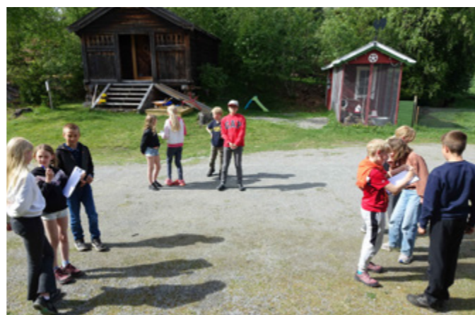
Bibelutdeling i Volbu 28. mai