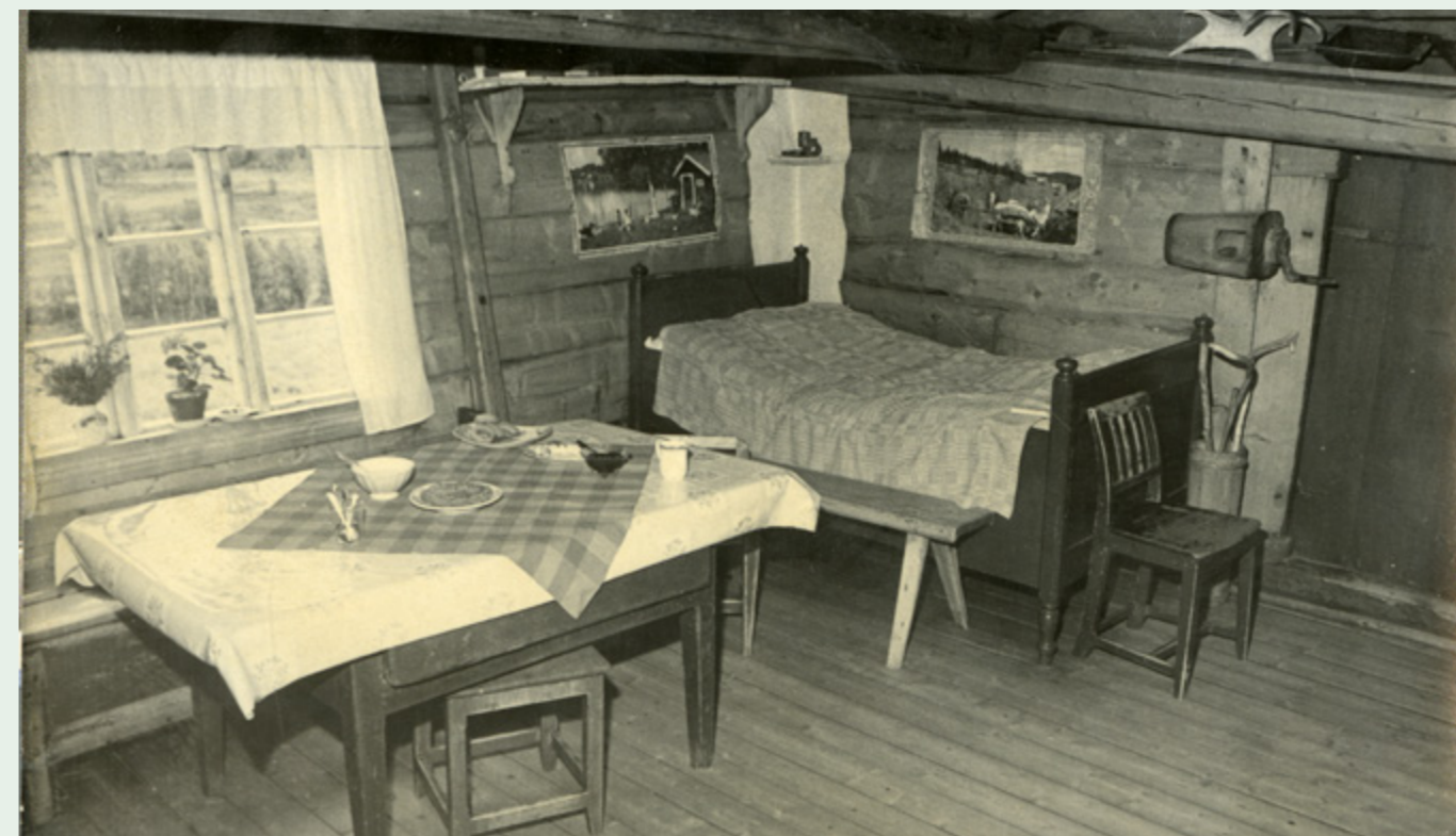
Interiør i Kristensnlægeret

I ØYSTRE SLIDRE har me noko me kalla læger. I tidlegare tider var det enkle husvære for arbeidskarar som kjøpte krøter på vår/ tidleg sommar og heldt dei gjennom sommaren før dei blei selde på hausten. Det var Rogne og Volbu soknekatte som leigde ut områda/husværa inne ved Fullsenn, helst til ein lokalmann/bygdemann, som då tok i mot utanbygdes fe. Det var eit bestemt tal med dyr dei hadde lov å ha med seg. Gjekk dei over dette talet eller utanom lægeret sitt område, måtte dei betala mulkt til «soknets fattigkasse».