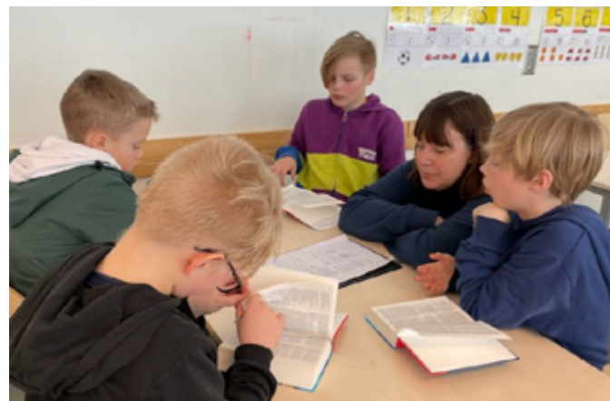
Bibelutdeling ved Lidar skule 19. mars