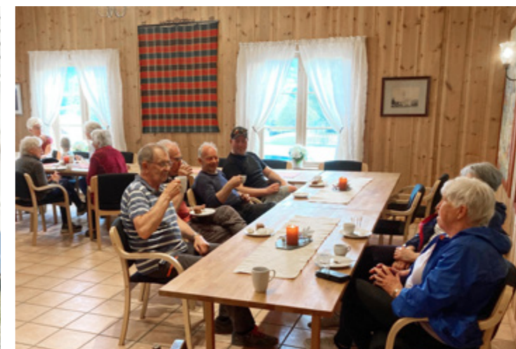
Kaffi og biteti i Rogne kyrkjestogo etter endt arbeid.