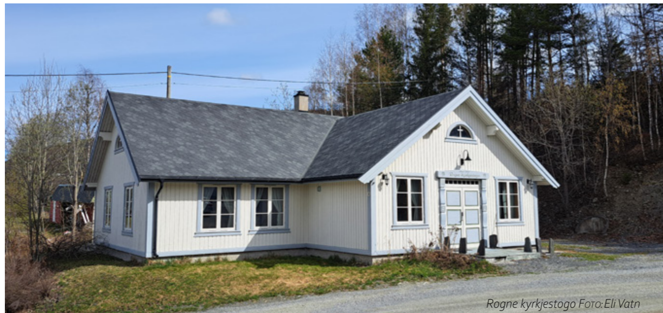
Rogne kyrkjestogo