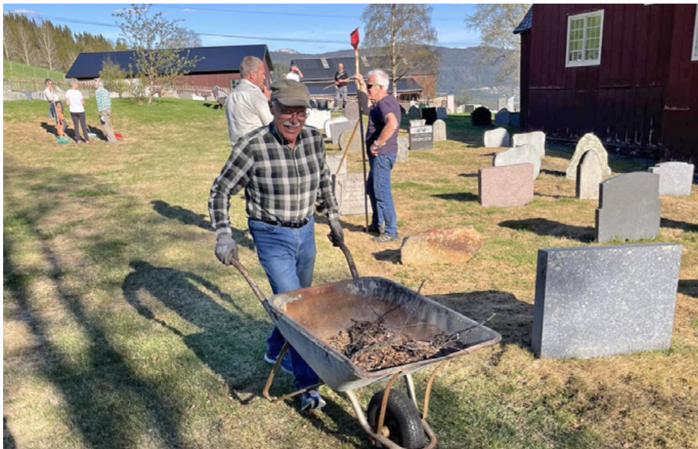
Dugnad ved Hegge.