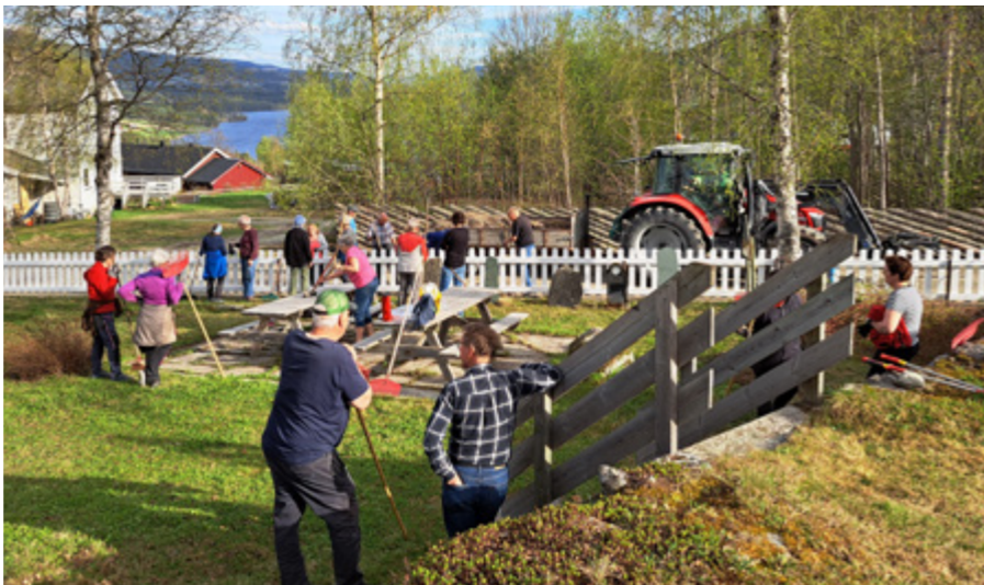
Frivillig engasjement.

K orleis forvaltar vi kyrkja sine verdjar? Kyrkja forvaltar store og viktige verdjar i samfunnet vårt. No spør fellestrådet og sokneråda korleis DU synest dei skal forvaltast. Vi har teke denne verddivandringa med fingrane på tastaturet og spurt ei kvinne og ein mann på førehand. Les og kjenn etter kva du sjølv meiner og svar på spørjeundersøkinga i bladet.