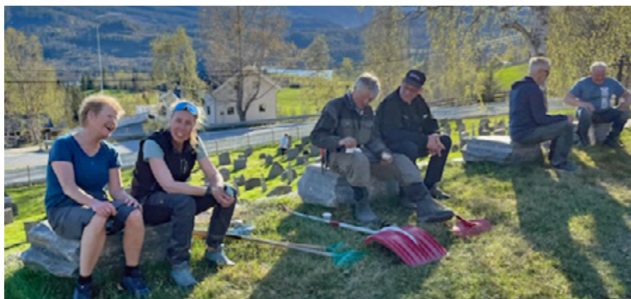
Ein pust i bakken. Dugnad ved Lidar kyrkje.