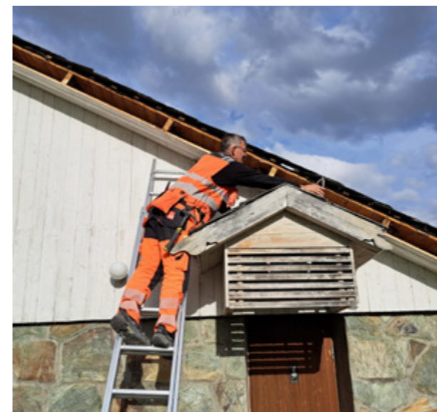
Volbu: Nye vindskier og måling blir fint på bårhuset.