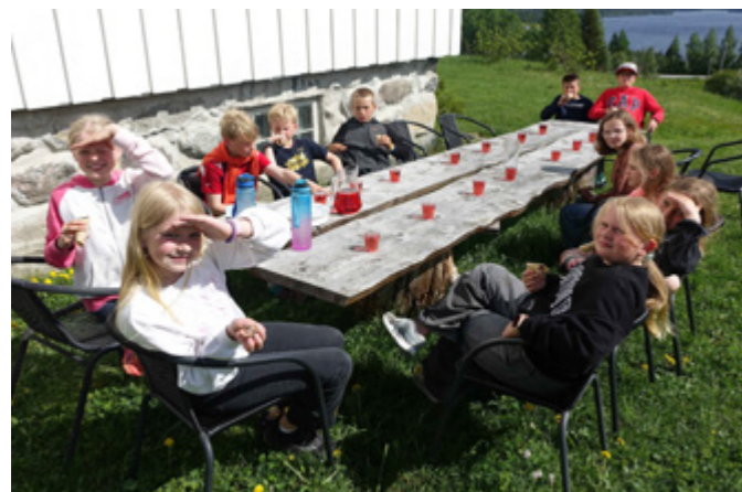
Bibelutdeling i Volbu 28. mai