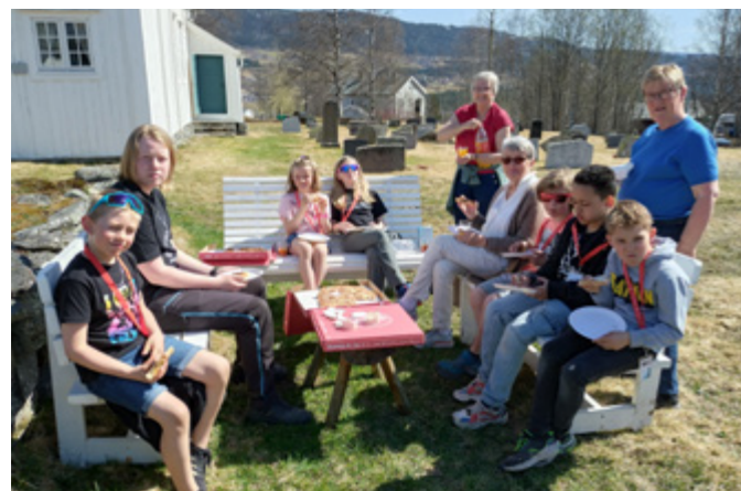
Tårnagenthelg i Volbu

Takk for bidrag og god hjelp frå stab, konfirmantar og representantar frå soknerådet!