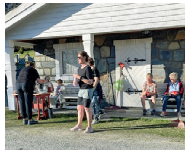
Dugnad ved Lidar kyrkje.