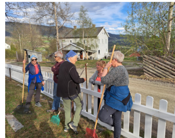
Og høve til ein god prat over gjerdet.