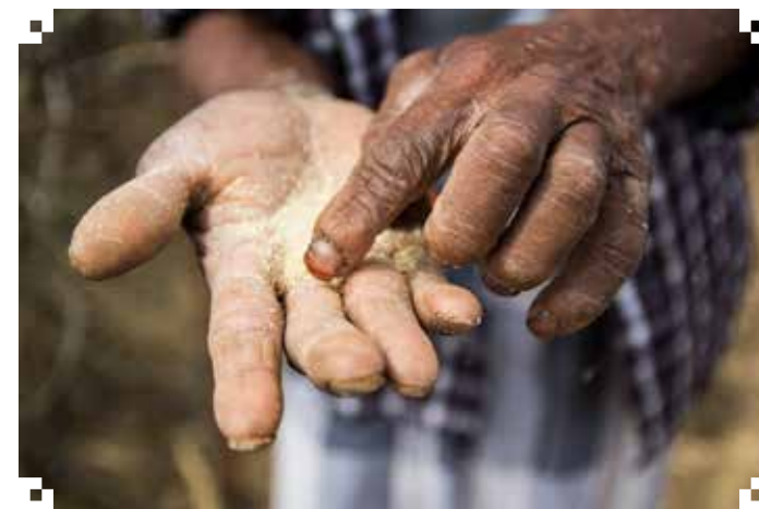
Den knusktørre jorda gjer det umogleg å få avlingar som kan seljast vidare på marknaden. Det vesle som kan høstast inn, blir brukt som dyrefôr.

Kirkens Nødhjelp treng di hjelp for å hjelpe. 13.-15. mars går Kirkens Nødhjelps fasteaksjon 2016 av stabelen. Dette er kyrkjelydenes eigen aksjon. Ditt bidrag gjer det mogleg for Kirkens Nødhjelp å vere der med reint vatn når katastrofen rammer. Difor håpar vi du vil støtte fasteaksjonen i Radøy, anten ved å stille som bøssebe- rar eller med pengar i bøssa. Vi oppmodar deg også til å bruke stemma di i fasteaksjonens klimakampanje og slik bidra til å stoppe klimakrisa.