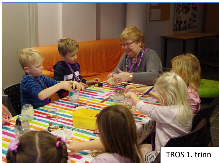
TROS 1. trinn

Disse tiltakene er det jevnt over godt fremmøte på. Vi er utrolig takknemlige for og heldige som har mange frivillige som er med på en eller flere av samlingene for barna på Tros! Tros 3.trinn avsluttes med Balubadagen, som er en aktivitetsdag for hele menigheten. Barna har et bruktmarked, masse aktiviteter og kafe. I 2019 samlet de inn kr 29.000,- som ble sendt til barnearbeid i Mustame menighet i Tallinn!