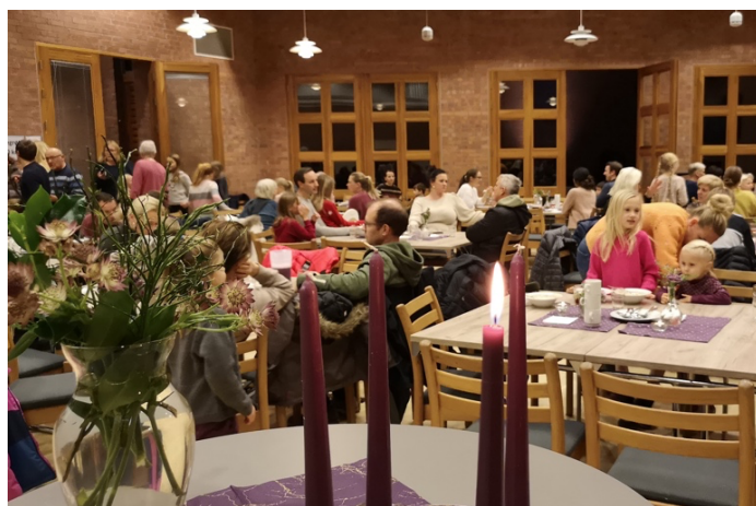
Ulike typer samlinger – inne og ute