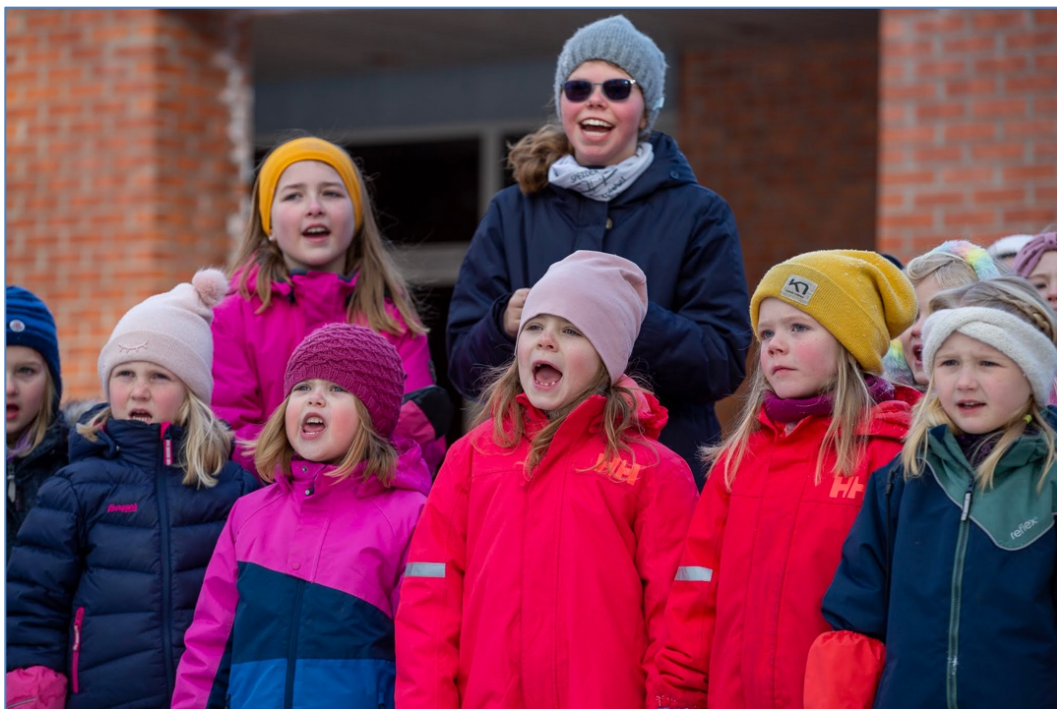
Barn fra Rabakoret synger på utegudstjeneste 14. februar

Rabakoret har fortsatt et høyt antall medlemmer, og det ser ut til at vi fremdeles holder lenge på de eldste barna. Fra og med 6. trinn får man muligheten til å være hjelpeleder. Hjelpeleiderne er utrolig viktige for Rabakoret. De er gode forbilder for barna og bidrar med å skape trygghet i et så stort kor som Rabakoret er.