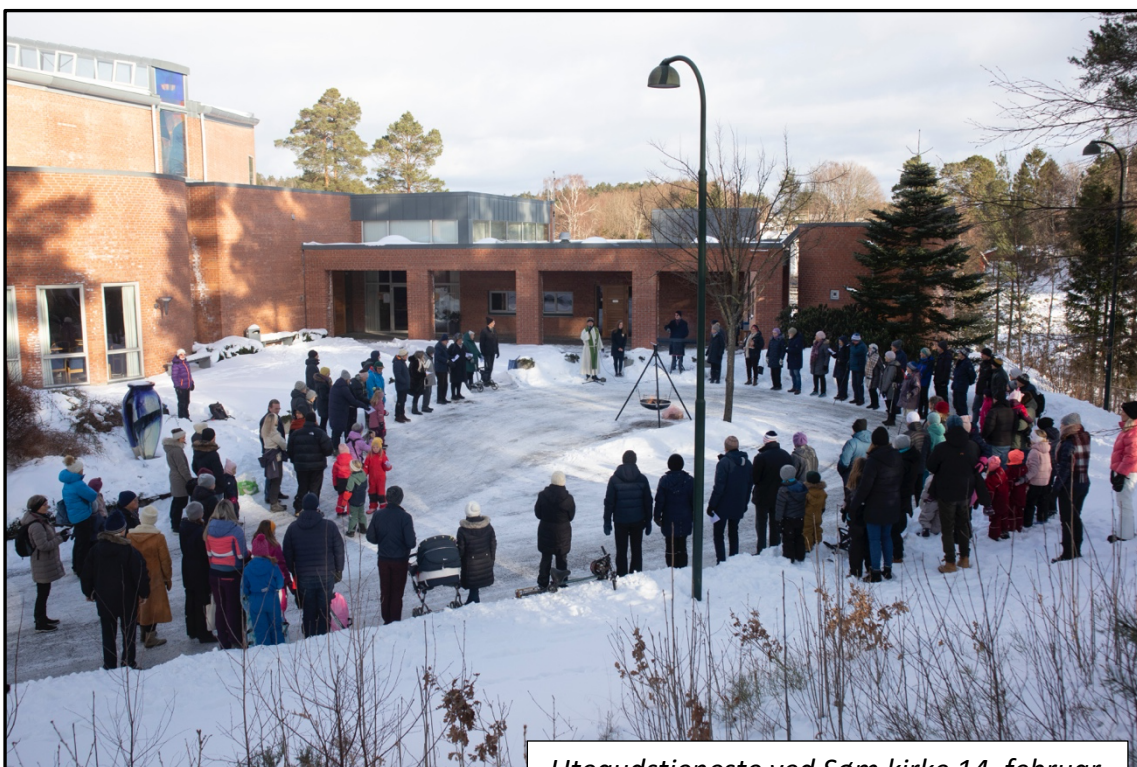
Utegudstjeneste ved Søm kirke 14. februar

Som i 2020 har gudstjenestelivet vært svært preget av pandemien. I perioder har det ikke vært lov å samles, eller lov å samles bare i redusert antall. Dermed er også gudstjenestedeltakelsen redusert. Vi har også hatt langt færre nattverd-gudstjenester enn normalt og derfor også langt færre nattverd-gjester. Statistikken for de ulike områdene i menighetens liv er derfor mindre interessant. Men staben har så godt som mulig lagt til rette for at menigheten kunne feire gudstjeneste på de forutsetninger som gjaldt til enhver tid. Policy har vært å bruke de «rommene» som til enhver tid gav seg til å samles, enten ute eller