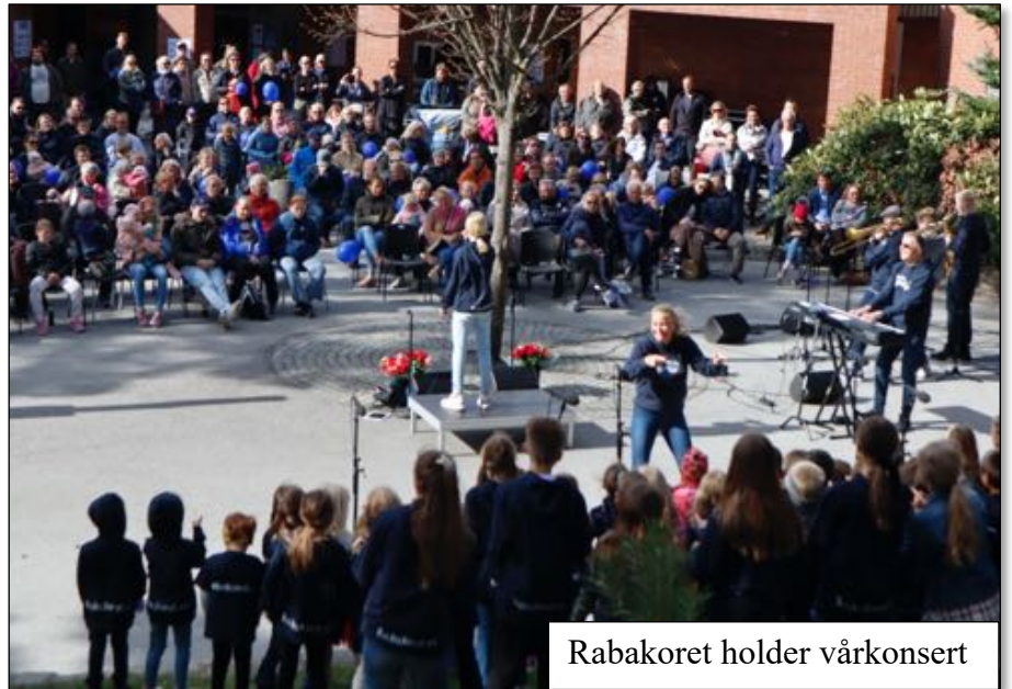
Rabakoret holder vårkonsert

Positive erfaringer siste år: Rabakoret er en viktig del av