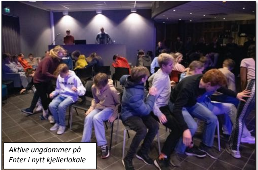
Aktive ungdommer på Enter i nytt kjellerlokale

På en vanlig Enter-kveld ligger fremmøte oftest mellom 20-50. Når konfirmantene er spesielt invitert, har vi vært oppe i rett over 100 på det meste.