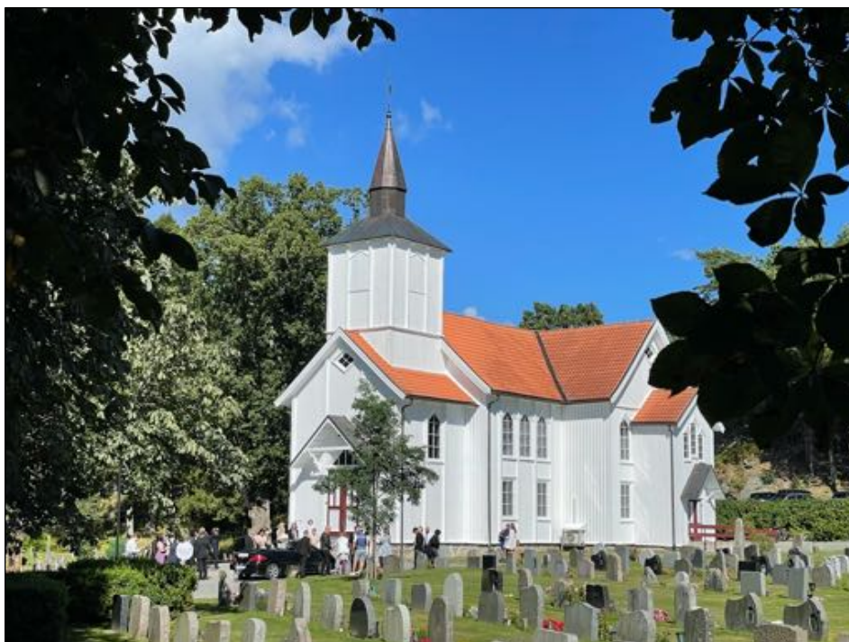
Det er bryllup i Randesund kirke. Åpen bil venter på brudeparet.