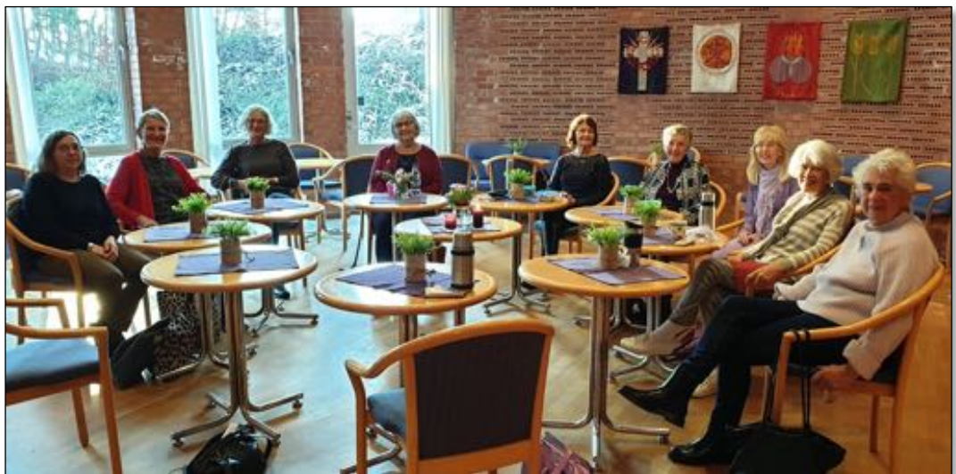
Kirkering-møte i kirkestua

Gjennom året har man medlemsmøter i hjemmene hvor det er enkel bevertning, ord for dagen, samtaler, håndarbeid, kollekt eller utlodning. Fint sosialt felleskap. Målet er å samle inn penger til nytte for menighetens drift og ekstra investeringer og for å ha felleskap og sosial tilhørighet i menigheten. Kirkeringene arrangerer også vårfest og julemesse. Julemessa arrangeres i samarbeid med stab.