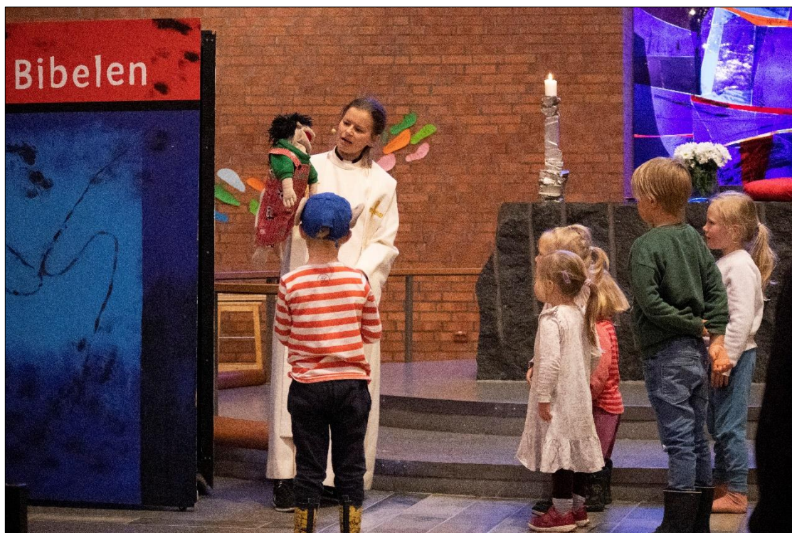
Barna er viktige i menigheten

Det er fortsatt utfordrende å rekruttere frivillige til søndagsskolen. Vi har per dags dato 4 frivillige; to voksne og to ungdommer. Vi befinner oss fortsatt i en sårbar situasjon når vi er så få ledere. Vi ønsker også at søndagsskolen skal være et møtepunkt for flere barnefamilier.