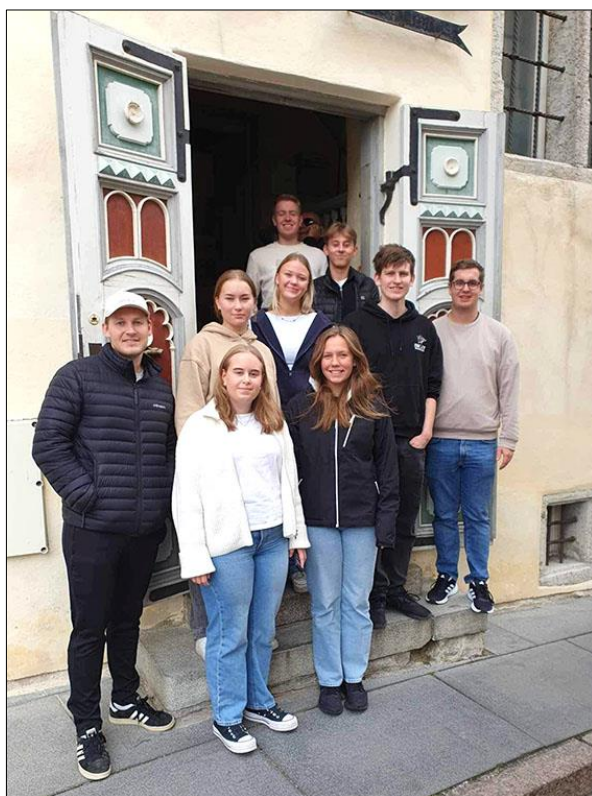
TØFF på besøk i Tallin

En utrolig viktig del av menighetens trosopplæring er det kontinuerlige barne- og ungdomsarbeidet som søndagsskole, kor, barnegrupper, ungdomsklubb osv. Fra januar 2023 endret vi navnet på Guttis og åpnet for jenter! Det er mellom 8 og 15 barn på hver Hobbyz samling!