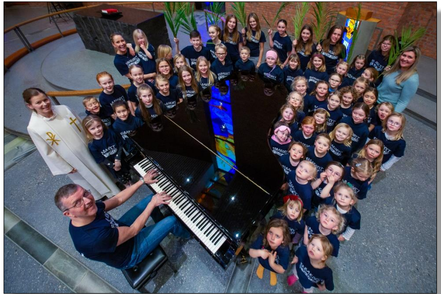
Rabakoret klar for TV-opptreden

Øvelse i kirka: 4 år -1. trinn torsdager kl 17:00-17:45 2. - 7. trinn torsdager kl 18:00-18:45