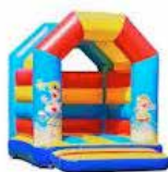
Hoppeslott for de minste