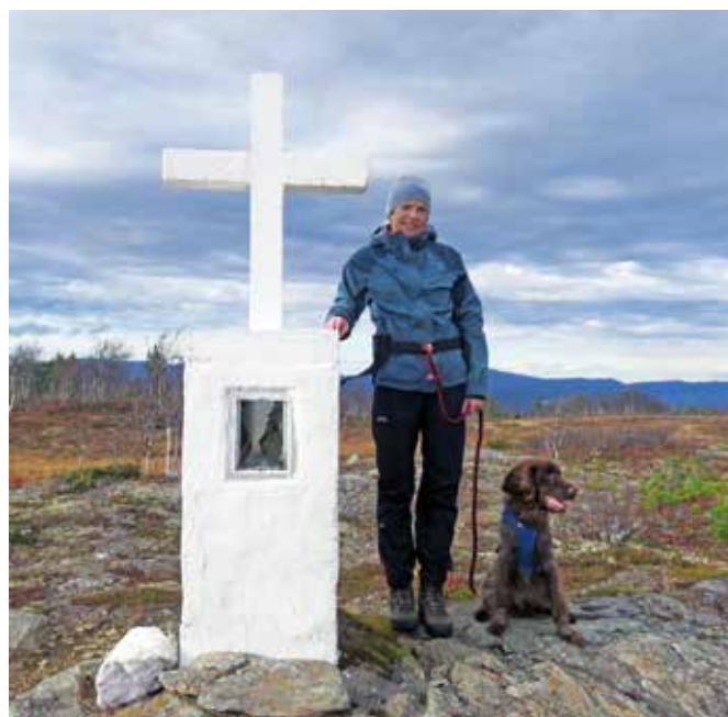
Et lite bønnetempel er blitt stående på grensa til Forllhogna nasjonalpark. Ingen vet hvem som har bygd det. Ingen har heller søkt om å få reise dette lille monumentet i lecastein (bildet) som kom opp i 2003. Men vakkert er det jo.