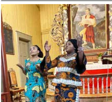
Glimt fra den internasjonale gudstjenesten i Berkåk kirke 28. januar.