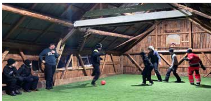
Inni låven var det supert å spille fotball.