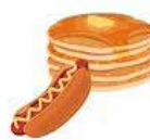
Pølser og sveler mm.