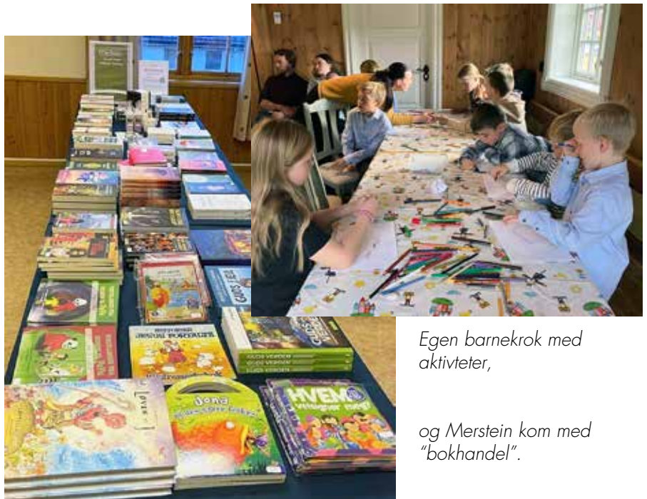
Egen barnekrok med aktiviteter,