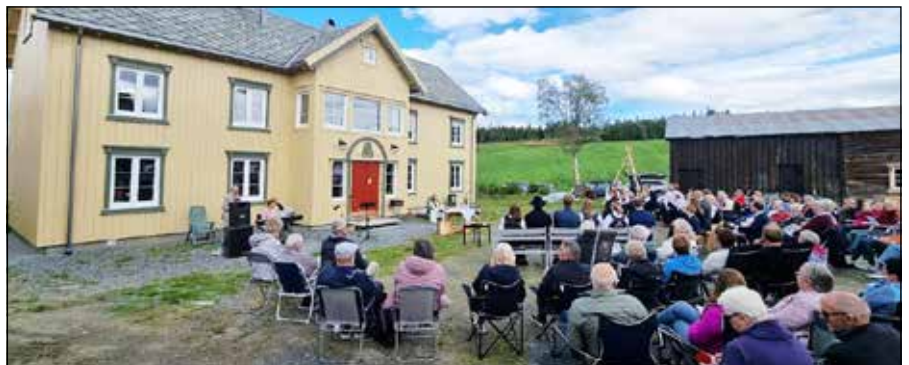
Friluftsgudstjeneste på Holtan gård sensommeren 2022.