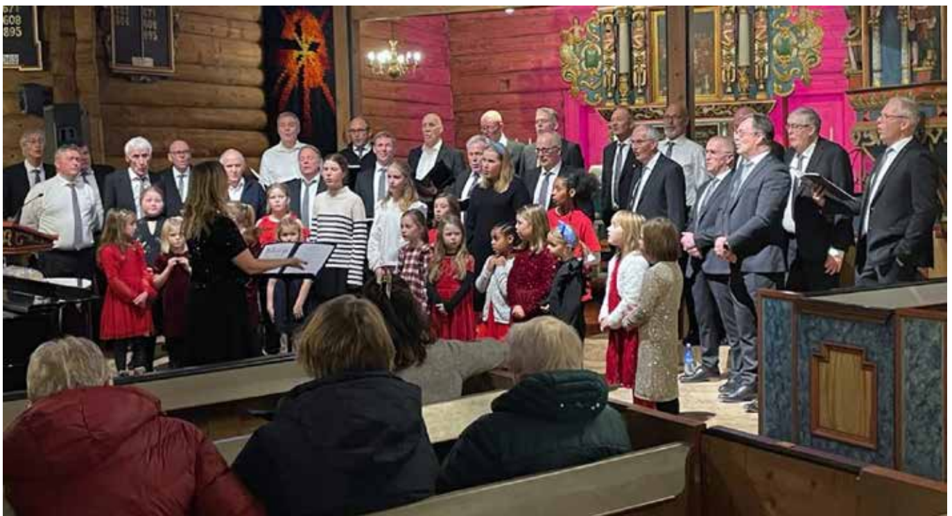
Manskoret og Soul Children fra konserten i Rennebu kirke 8. desember.