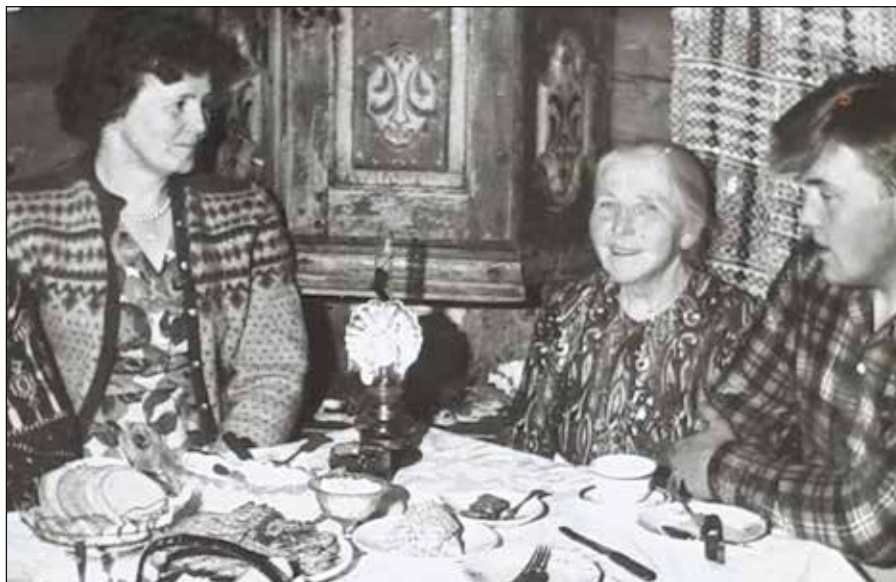
Anna i godt lag

Tante er snill. Hun har omsorg for både folk og dyr. Hun forstår når veslejenten lengter hjem til mor og far. Da blir hun gjerne med på leken eller leser en god historie. Ingen har bedre innlevelse i en god historie enn tante, men Donald Duck kan hun ikke noe med. Da er det bedre å lese sjøl. Når det