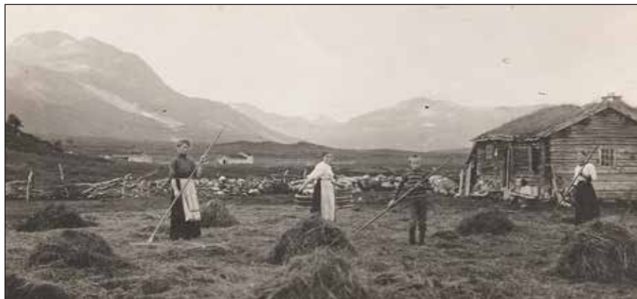
Jelsætra, onn 1912