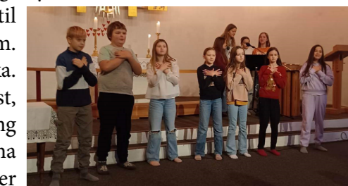
Lysvåken i Salangen kirke.

til adventsfortellinga og mye mer. Om kvelden kom foreldrene med pizza til oss og deretter så vi film. Barna overnatta i kirka. Søndag var det frokost, pakking og mer øving til gudstjenesten. Barna var aktivt med under gudstjenesten, vi hadde ei fin adventsfortelling som de gjennomførte. Deretter var barna og familiene deres med på kirkekaffen. Ei fin og hektisk helg.