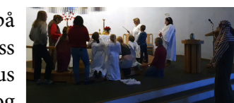
Krybbevandring i Salangen kirke.

5-åringene fra barnehagen var på krybbevandring i kirka. Vi kledde oss ut og gikk tilbake i tiden, om da Jesus ble født. Populært for både små og store.