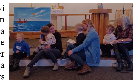
Utdeling av 4-årsbok i Salangen kirke.

I februar inviterte vi 4-åringene til kirka. De kom litt før gudstjenesten og da øvde vi på tegn til sangene og på å gå i prosesjon. Under gudstjenesten var barna aktivt med, de fikk 4 års boka og så fikk de tegne på et stort ark som var på gulvet. Deretter var barna og familiene med på kirkekaffen.