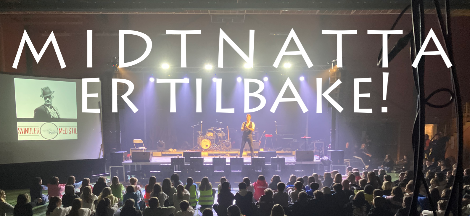
Tekst og foto: Trond Oscar Losvik

ETTER TO ÅR MED AVLYSNINGER PÅ GRUNN AV SMITTEVERNILTAK ER ENDELIG MIDTNATTA TILBAKE. ARRANGEMENTET VAR EN SUKSESS, OG BÅDE UNGDOMMER OG VOKSNE FRA LAVANGEN OG SALANGEN BIDRO STERKT.