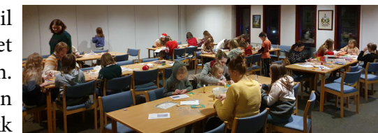
Juleverksted i Salangen kirke.

Vi inviterte også til juleverksted og det kom mange barn. De laget mye fin julepynt, som de fikk med seg hjem. Ellers så koset vi oss med mandariner og pepperkaker.