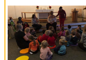
Barnehagen på besøk i Salangen kirke.

Før jul hadde vi besøk av 3-åringene fra barnehagen. Vi leste min første bok om julen, sang julesanger og ungene fikk leke i kirka. En koselig førjulsstund med de små.