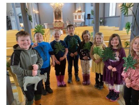
Fra påskevandringa i Lavangen kirke 2022.

29. mars er det påskevandring i kirken for barn 6-9 år. Barna inviteres til å få ta del i Jesu vandring de siste dagene i påsken.