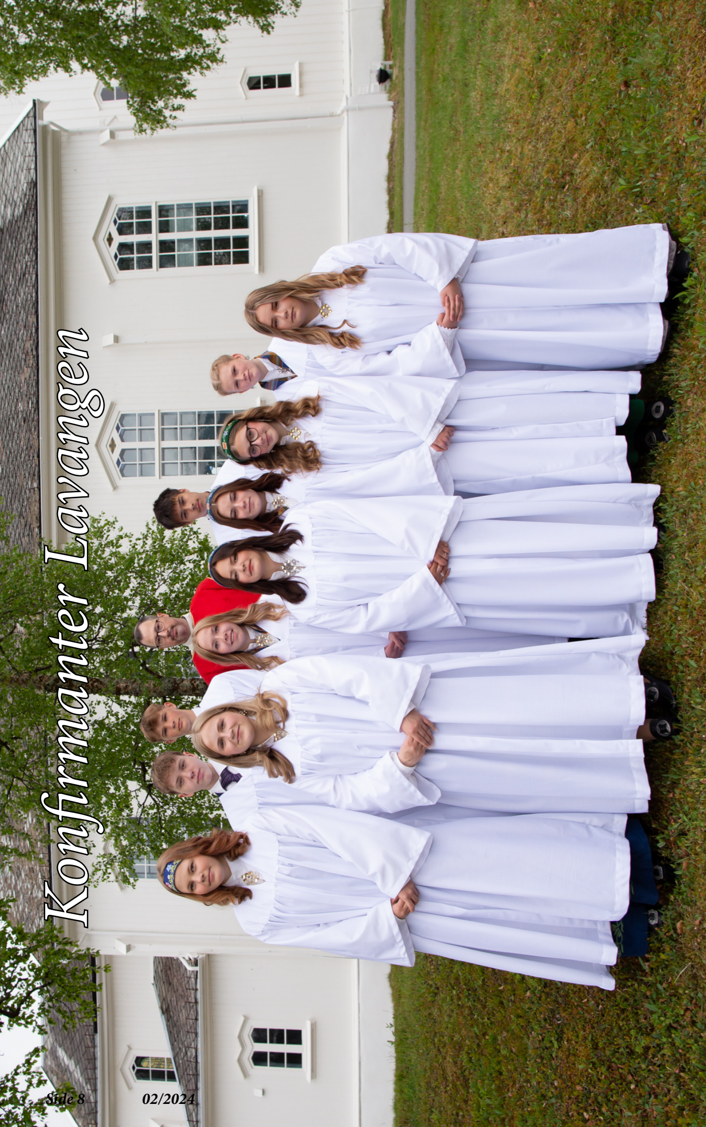
Fremme fra venstre: M. Bak fra venstre: M.