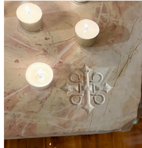
Altrene er lagd av marmor som er hentet ut av det samme steinbruddet som de originale søylene i Fødselskirken i Betlehem ble hentet fra. Pilegrimssymboler er sandblåst inn i steinen.

Som en markering på at alterbordene er en gave fra Pilegrimsfelleskapet fant vi de at pilegrimslogoen skulle sandblåses i steinen. Og for å bevare steinen på best mulig måte, har de valgt å beskytte den med en glassplate. Symbolverdien i disse alterbordene er særlig stor i samarbeidet med