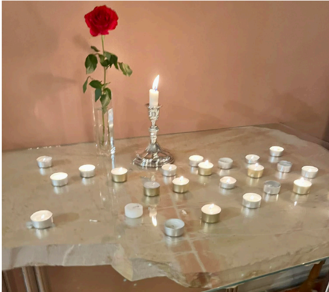
Sidealtrene i Sarpsborg kirke er nå på plass, og skaper en ekstra sterk symbolikk i lystenningen.