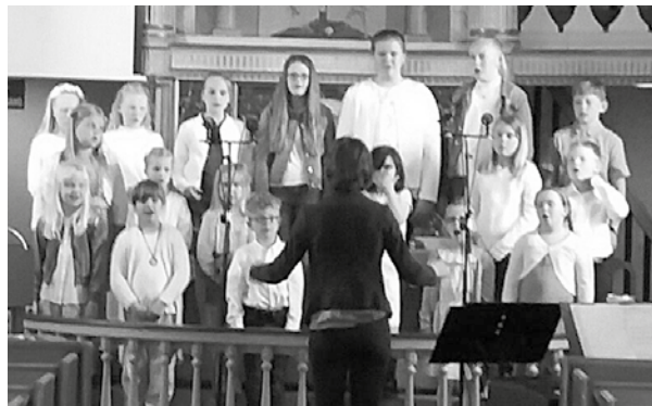
En gruppe fra Ingedal, Ullerøy og Skjeberg kirkes barnekor sang på gudstjenestene

Trosopplæring etter skolestart Skolestartmarkering er en del av menighetene i den norske kirke i Skjeberg sitt tilbud om trosopplæring. Alle døpte og barn av medlemmer i den norske kirke får invitasjoner til trosopplæring for deres alder i posten. Trosopplæring er åpent for alle. Det er altså mulig å invitere med venner og familie som ikke tilhører den norske kirke i Sarpsborg.