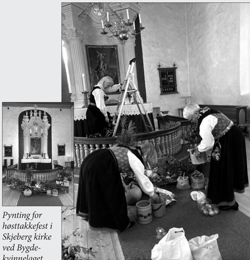
Pynting for høsttakkefest i Skjeberg kirke ved Bygdekvinnelaget.