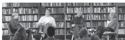
Fra Temakveld om krenkelser på Litteraturhuset i Fredrikstad, 2023.