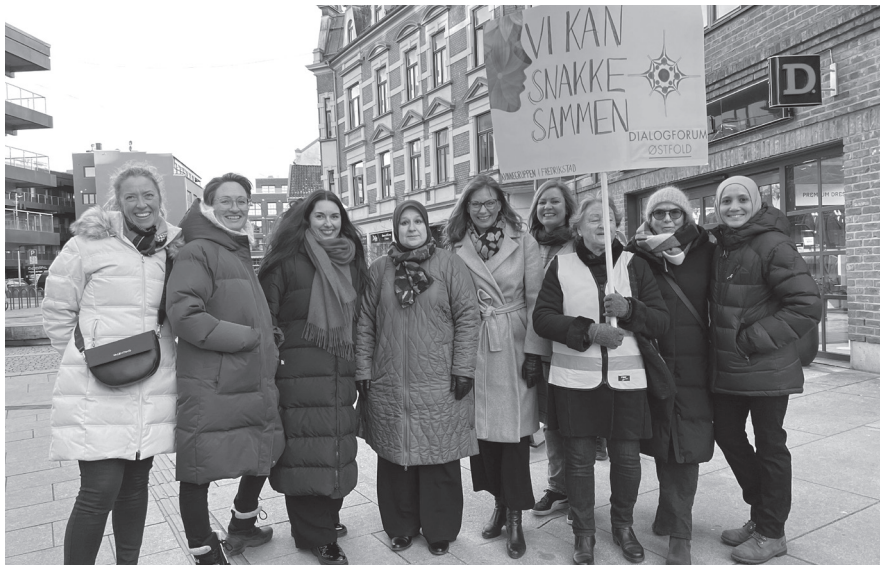
Dialogforums kvinnegruppe i Fredrikstad markerte kvinnedagen 8. mars 2023.

være forbilder i fredelig sameksistens. Ungdommer kan dele felles erfaringer i forhold til det å være ung og troende. Kvinner kan styrke hverandre og vise at vennskap er mulig på tvers av ulikhet, slik Dialogforums kvinnegruppe i Fredrikstad gjorde gjennom felles markering i årets 8. mars-tog. Sammen kan vi motvirke fordommer og bidra til trygge lokalsamfunn med rom for alle.