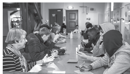
Dialogforum Østfold arrangerer Dialogdag i skolen for stadig flere ungdomsskoler.