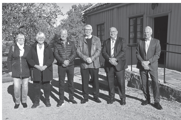
Disse var samlet til fest i Vestfløya etter gudstjenesten i Ullerøy og Skjeberg 29. september

For de som ønsker oppdatert info på mail hver søndag kveld, send din mailadresse på sms til 911 22 615.