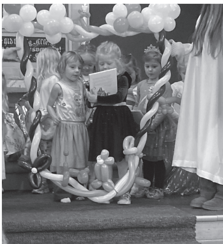
4 åringene syntes det var spennende å få bok i kirken