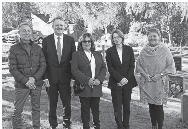
50 års konfirmanter fra Ullerøy.

Du kan også Vippse en gave til Menighetsbladet