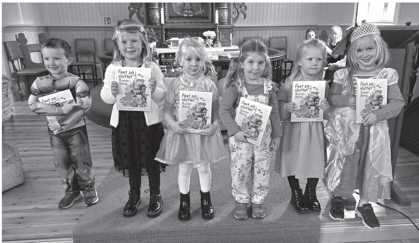
Barna fikk 4 års bok i Ullerøy 13. oktober.