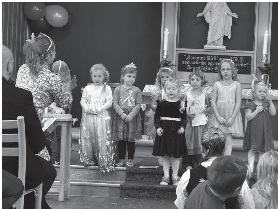
Stjernekoeret synger på gudstjeneste