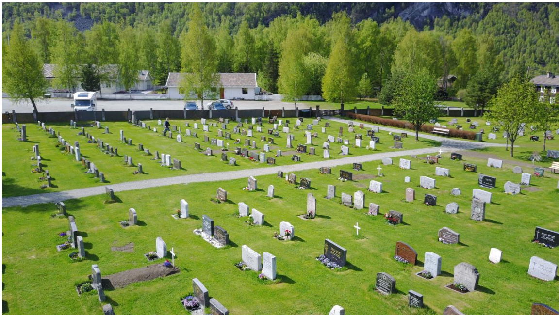
Fra Sel kirkegård