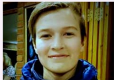
Herman Braathen Engehaugen menighet «Glad – ektiv – seriøs»

–Hvordan har det vært så langt i kveld? «Jeg synes det har vært kjempebra, bra show» –Hvilke forventninger har du til konjrmantida? «Jeg tror jeg kommer til å få nye venner, og at vi lærer mye» –Hvorfor valgte du kirkelig konjrmasjon? «Jeg valgte kirkelig konjrmasjon fordi jeg følte det er her jeg tilhører. Det er en tradisjon i familien.» –Tror du LUPY kan være noe for deg? Ja!