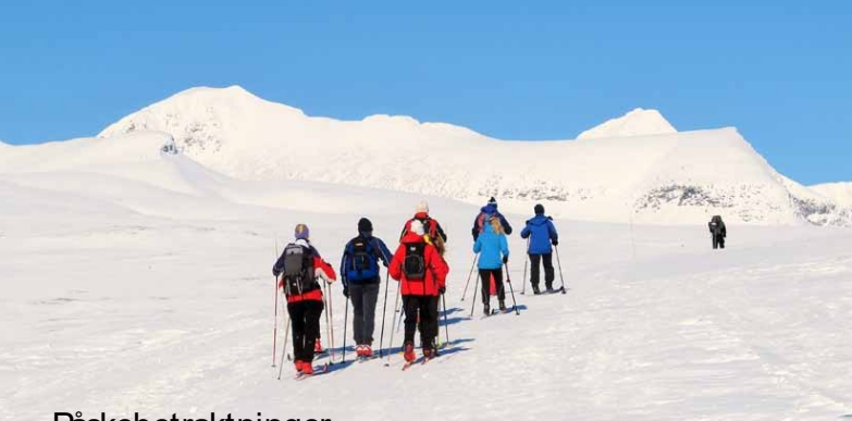
Mot Rondane i påscesol.