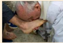
Pave Frans vasker ångers føtter

«Rein og skjær» sier vi. De to ordene er synonymmer. Skjær betyr rein. Skjærtorsdag er den rene torsdagen fordi Jesus denne siste kvelden med disiplene bøyde seg ned og vasket deres føtter. Peter ville hindre Jesus i å gjøre noe som bare tjenerne gjorde, men Jesus insisterte, og etterpå sa han: Når jeg som er herren og mesteren, har vasket