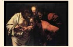
Caravaggio: Tvileren Tomas

Påskedag For disiplene falt alt i grus langfredag. Alt var over. Men korsfestelsen ble ikke slutten på Jesusbevegelsen slik alle regnet med. Også historikere er enige om at noe må ha skjedd. Påskedag, grytidlig om morgenen, kommer Maria Magdalena og noen andre kvinner til Jesu grav som er tom. De er overbevist om at noen må ha stjålet liket, inntil de opplever noe som beskrives som et sjokk, ja som noe skrem-