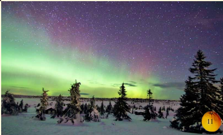
Nordlyset fotografert på Sjusjøen av pater Reidar Voith.