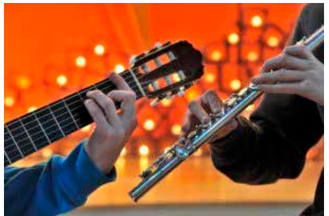
Gitar og fløyte er ofte brukt i Taizèinspirerte gudstjenester.

Uansett er du velkommen til Buvik kirke for å sjekke ut om denne gudstjenesteformen tiltaler deg!