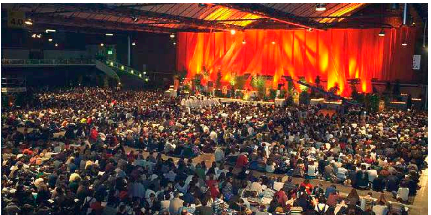
Titusenvis av ungdommer fra hele verden reiser hvert år til Taizè i Frankrike for å oppleve dette økumeniske fellesskapet.