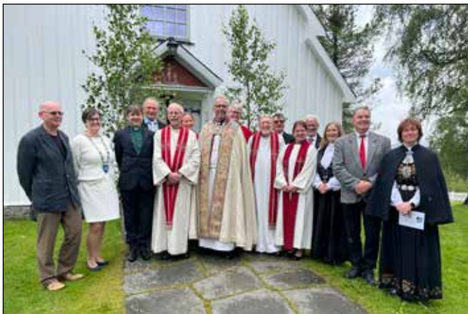
Tekst: Soknerådsleder Bente Bråten Dokken

Leirskogen kyrkje fylte 100 år 18. mars 2024 og feiringen begynte med konsert ved PUST 16. mars. En vakker opplevelse for alle som var til stede denne dagen.