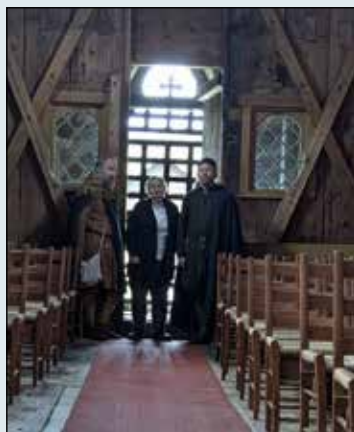
Riddere omflakkerer guiden

Tekst: Liv Barbro Veimodet.