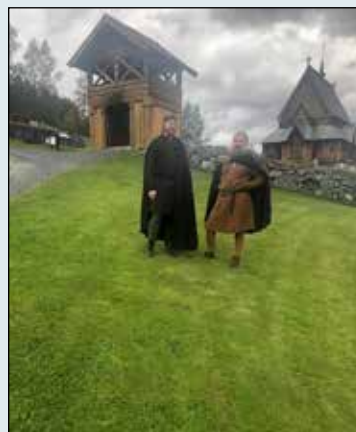
Riddere på kirkebakken.