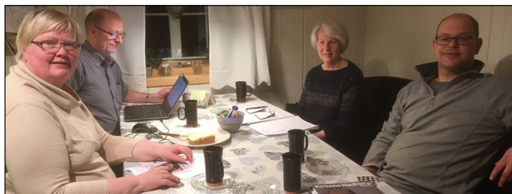
Begnadalen menighetsråd.

En undersøkelse blant menighetsrådsmedlemmer viste at et stort flertall trives og opplever det som meningsfylt å være med i menighetsrådet. 85 prosent synes vervet er mer eller like tilfredsstillende som de hadde forventet.