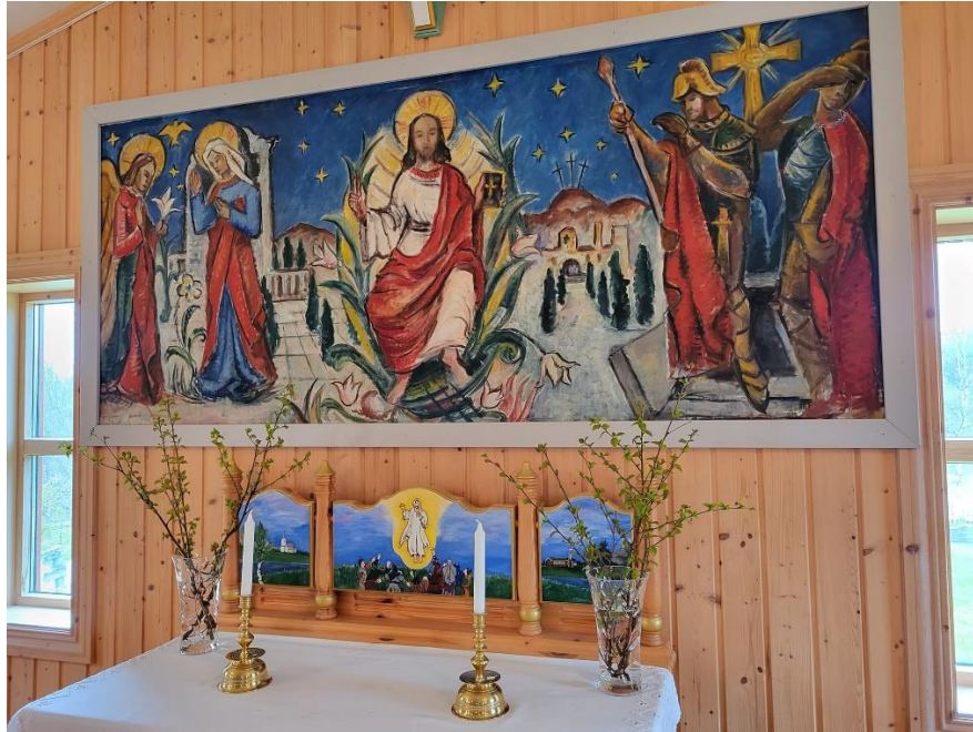
Alteret i Sela fjellkirke bildet er tatt 4. juni 2023