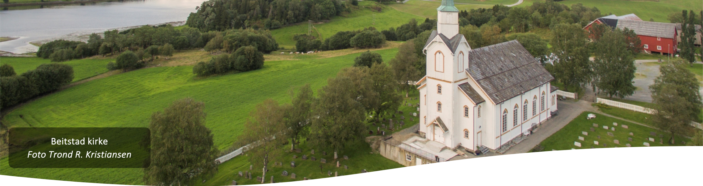
Beitstad kirke