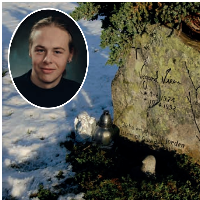
Gravsteinen til Vegard på Lånke kirkegård kommer fra Teveldalen der Vegard var mye og likte seg veldig godt.