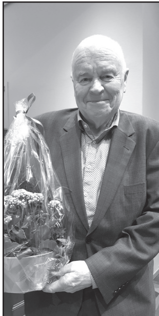
mentet for huset heldt nok fram.