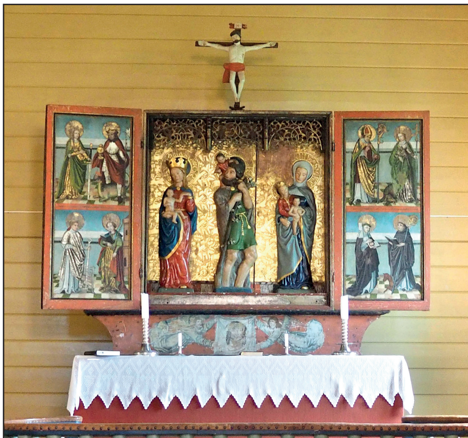
Altarskåpet frå 1510 i Vevring kyrkje har dører som kan låsast att.

Vevring kyrkje har ei eineståande altertavle, både når det gjeld utskjeringar, måling og symbolriksdom. Altertavla har form som eit altarskåp og er truleg frå kring 1510.