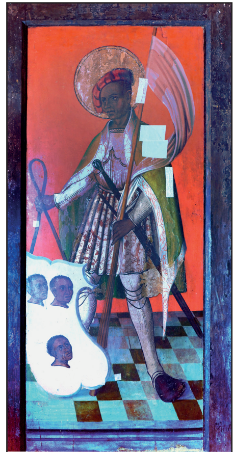
Bak eine døra på alterskåpet finn vi biletet av St. Mauritius frå Øvre Egypt.

i år 287 ein hær over Alpane som hadde i oppdrag å slå ned eit opprør i Gallia. Mauritius sin legion var med i denne hæren. Ved Octodurum ved elva Rhône fekk heile hæren ordre om å ofre til gudane på romersk vis for å sikre militær suksess. Den kristne legionen nekta, og i protest trakk dei seg tilbake til Agaunum (no Saint-Maurice-en-Valais i kantonen Wallis i Sveits), og slo leir der. Ein variant av legenden seier at legionen og fekk i oppdrag å utrydde alle kristne i området, men at Mauritius svara: «Vi er soldatar, ikkje mordarar». og nekta å delta i nedslaktinga av medkristne. Som straff og avskrekking blei legionen desimert, det tyder at kvar tiande mann blei henretta. Det hadde inga verknad; Mauritius mana sine menn til å stå fast ved trua. Då dei fortsatt nekta å ofre til gudane, blei på nytt kvar tiande mann henretta. Dei øvrige sto framleis like fast og sa: «Vi har sett våre kameratar bli drepne, men