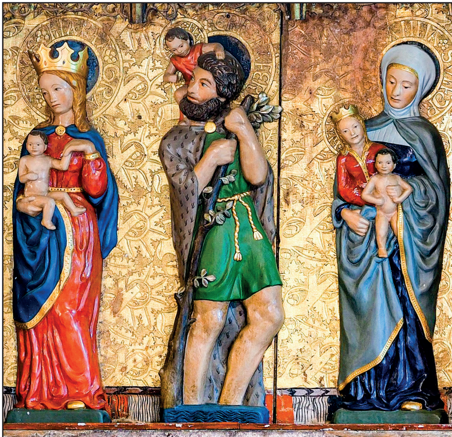
Hovudfeltet viser Maria, St. Kristoffer og Anna, mor til Maria, som alle ber Jesusbarnet.