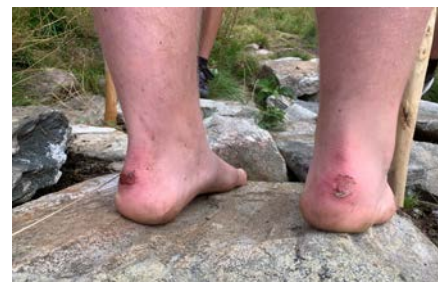
Gnagsår bøyrrer med til ein pilegrim sin kvardag.

Ved starten av turen får konfirmanntane høyre litt om pilegrimsvandring som ein gamal tradisjon og symbolikken ved det som ein pilegrim kler seg i og ber med