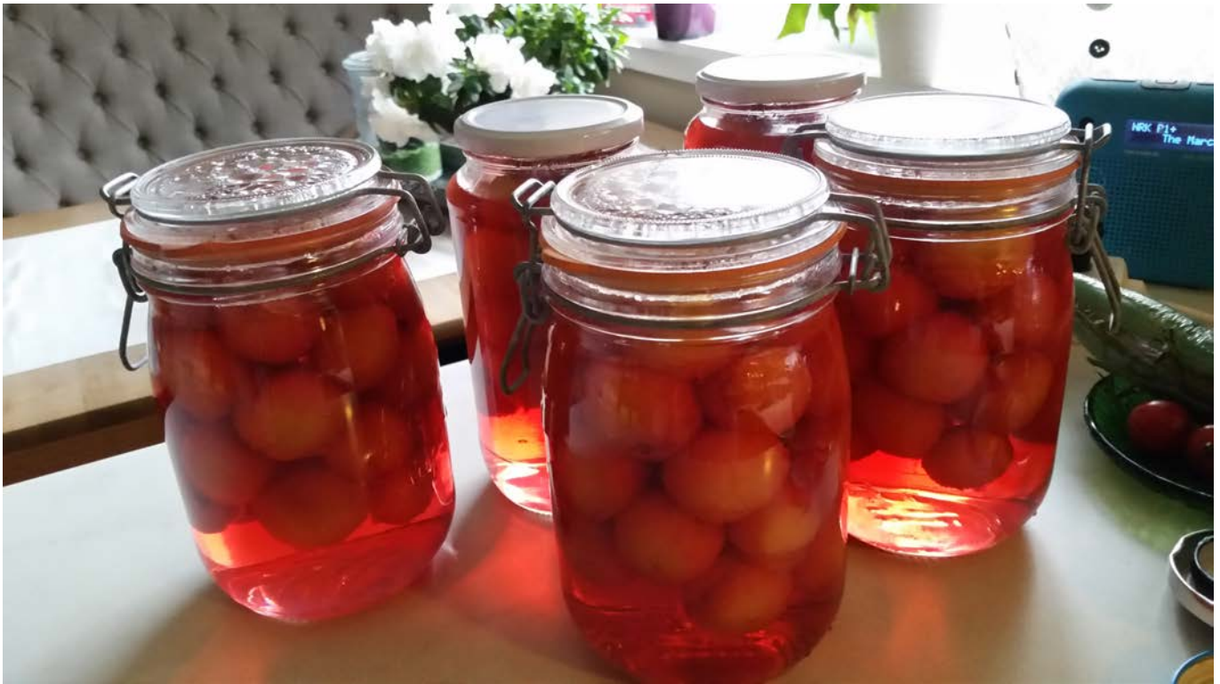
Krukker og glas vart fylte med velsmakande og solmodna bær og frukt denne hausten.