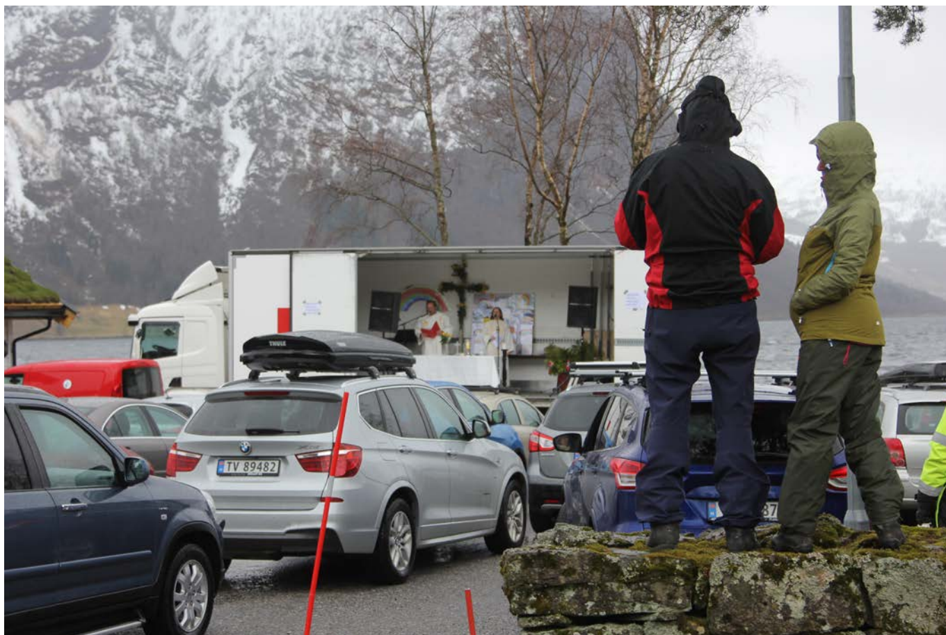
Utegudstenesta ved Helgheimskyrkja 1. påskedag vart den første etter nedstenginga i mars og den første utegudstenesta i fjor.