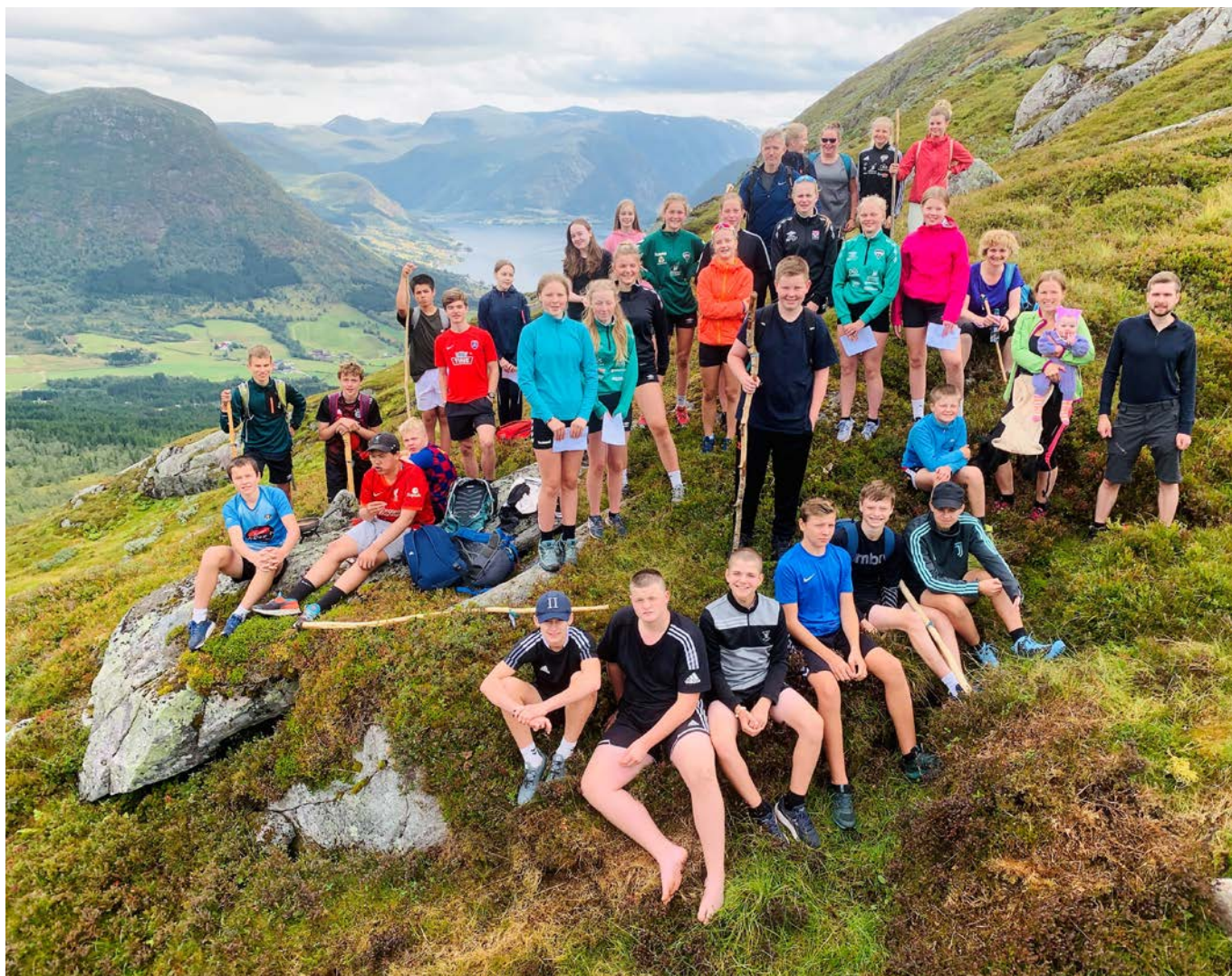
Heile gjengen samla på fjellet mellom Årdalen og Ålbus.