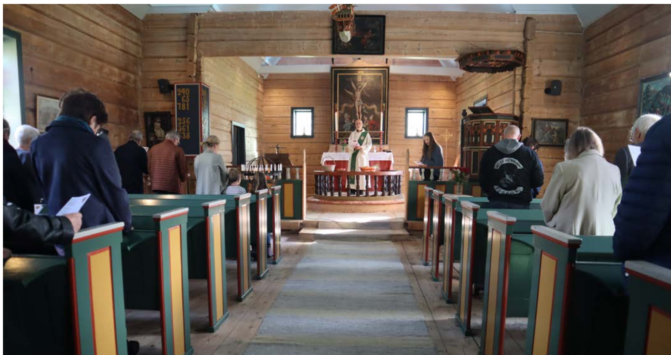
Gudsteneste med koronarestriksjonar i Ålbus kyrkje