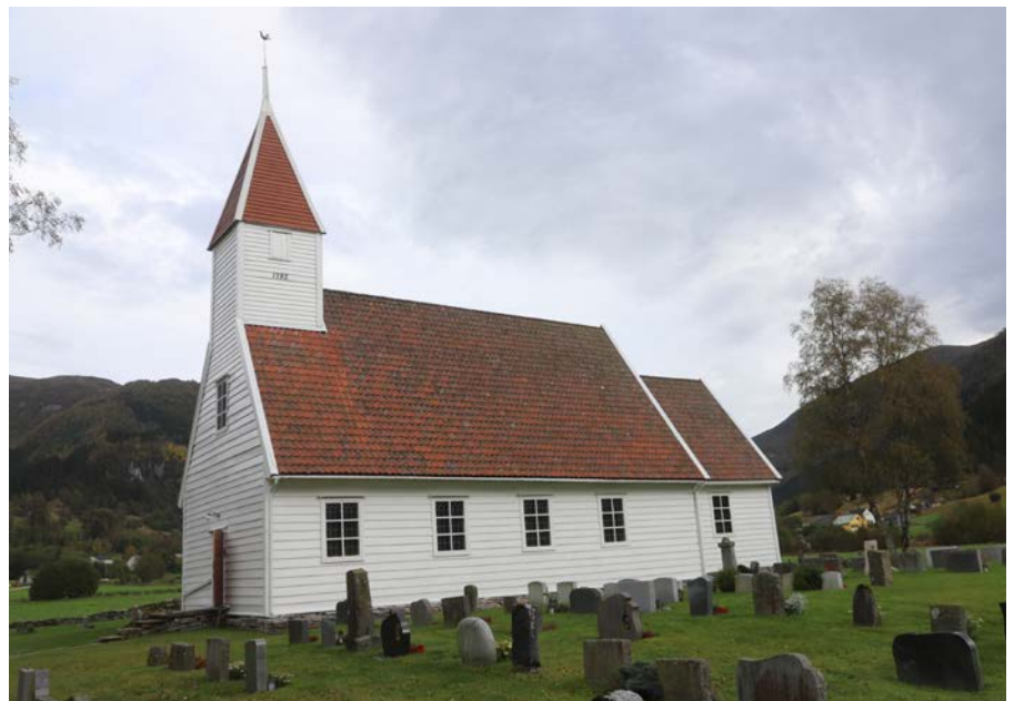
Ålbuskyrkja var mål for pilegrimsvandringa.