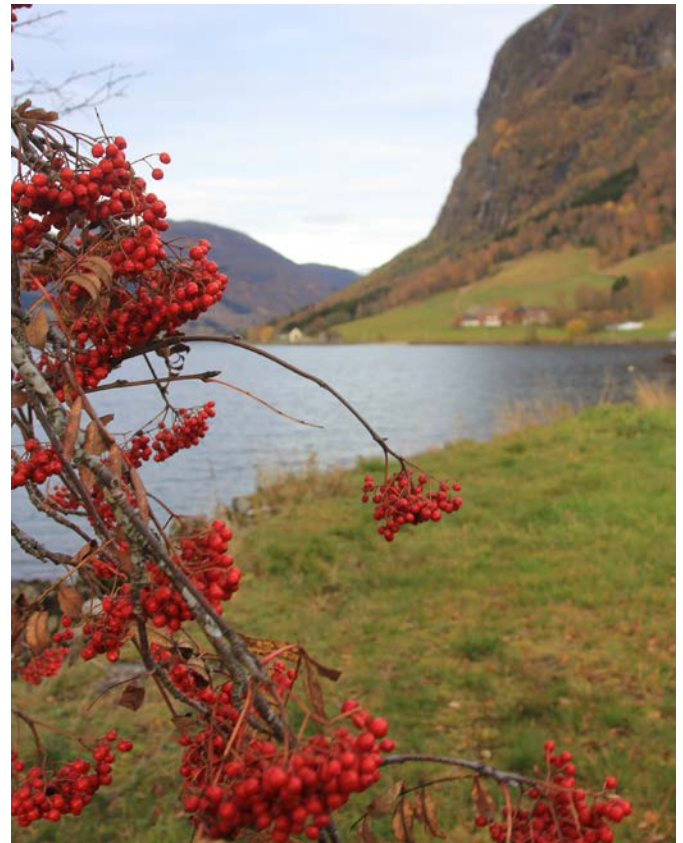
Det er mykje rognebær i år og rognen skal ikkje bere to borrar, heiter det. Det skulle tyde på lite snø til vinteren..eller?

Eit anna teikn som eg har fundert mykje på fleire somrar, er reirbygginga til ymse fuglar, og eg har ikkje funne heilt ut av det. Det blir sagt at når fuglane som bygger reir i mur, bygger reiret lågt ned i muren vert det ein varm sommar. Fuglen vil nemleg nyttiggjere seg av den kulden som kjem frå jorda som ligg i skugge. Dette teiknet har i alle fall ikkje alle fuglar skjont eller så stemmer det ikkje. Eg har mange murar rundt huset og dei reira eg har observert i sommar ligg heilt opp i øvste steinrada i murane. For fuglane som byggjer