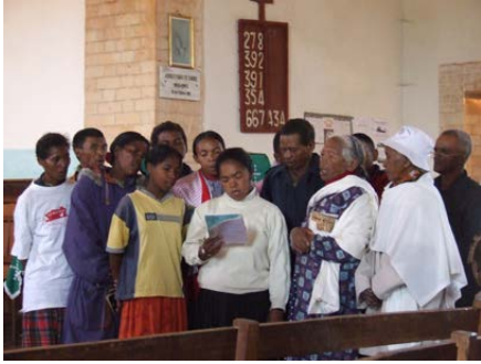
Då ei gruppe frå Førde kyrkjelyd vitja landsbyen, var senteret i drift. Her syng ei gruppe bebuarar for gjestene.