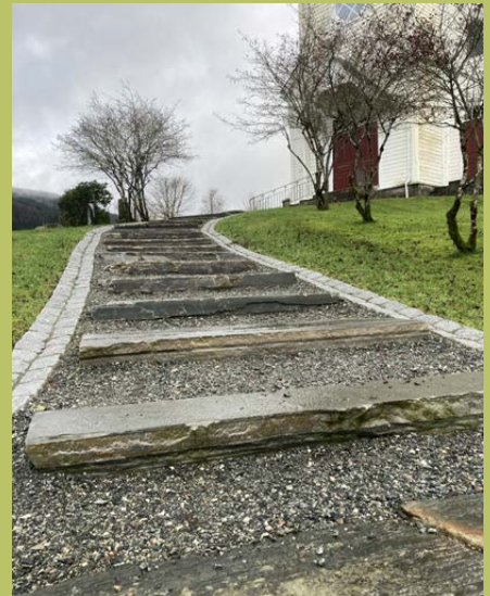
Ny trapp frå portalen til kyrkja.