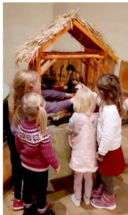
Julekrybba i Førde kyrkje.

I ungdomstida mi var det ein flink forkynnar som ofte var med oss ungdommane. Ein gong hugsar eg han sa at det er eit rom i Guds hus for akkurat deg. I det rommet står bøkene eg liker å lese, gitaren min, det er innreda og laga til for akkurat meg. Eg syns den måten å sjå det på er fin, for eg treng å vite at det er rom og plass for