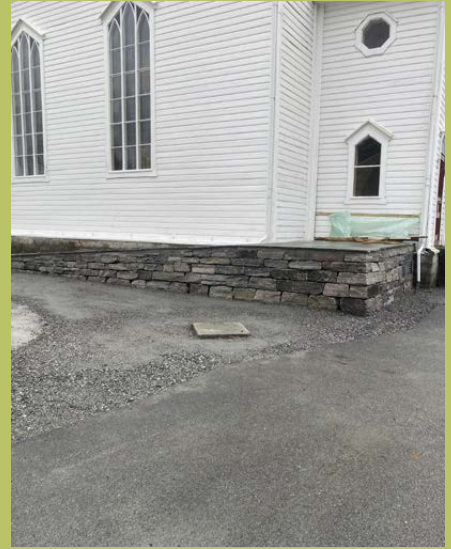
Her kjem rekkverk langs rampa og ny dør inn til våpenhuset.

På nordsida av tårnet er ein ny rullestolrampe i ferd med å ta form. Dette arbeidet er ikkje ferdig når bladet går i trykken. Rampen er mura opp med tilhoggd stein og går i eitt med kyrkjegardsmuren. Ny dør er enno ikkje komen på plass, og det manglar rekkverk, men det skal vere ferdig før jul. Om-