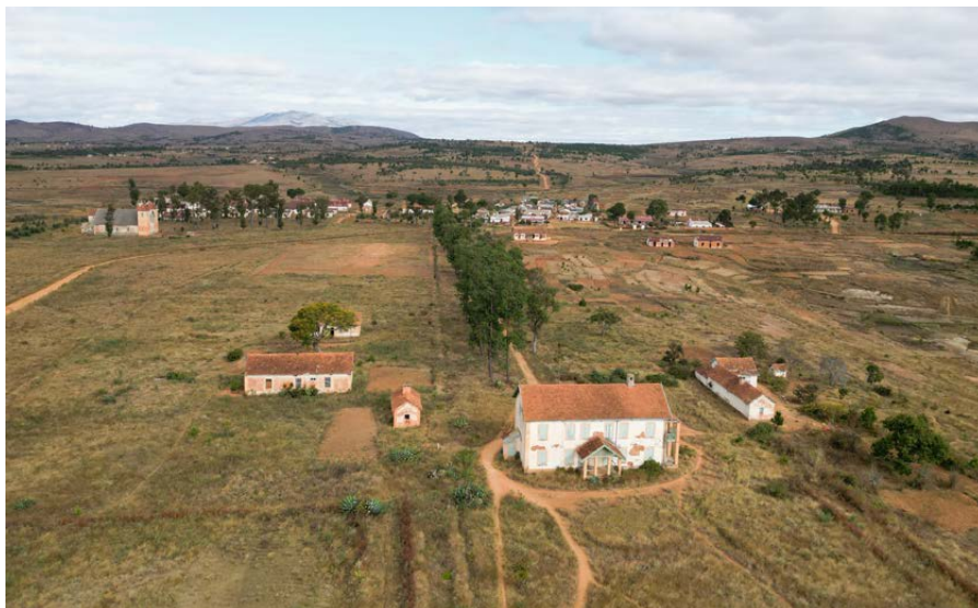
Mangarano – her budde opptil 800 leprasjuka.

Etter at ein fekk medisinar som heldt sjukdomen i sjakk, gjekk innbyggjartalet nedover. I 2006 drog ei stor gruppe frå Førde kyrkjelyd til Madagaskar, og eit besøk på Mangarano var obligatorisk. Då hadde landsbyen framleis bebuarar som var avhengige av behandling. I 2015 vart det slutt på drifta og senteret blei lagt ned. Sidan har husa stått tomme og til nedfalls.