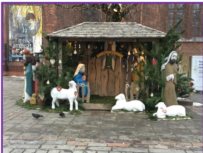
Julekrybben som blir satt opp hver jul i Kaunas i Litauen. Jesubarnet mangler - Jesubarnet i krybben kommer ikke før juledagen.

I alle landene vi har bodd, er det Jesubarnet som er sentrum for julefeiringen, men tradisjonene i det enkelte landet gjør at vi feirer på litt forskjellige måter. Det er spennende å ta noe fra alle tradisjonene med oss hjem til vår egen julefeiring.