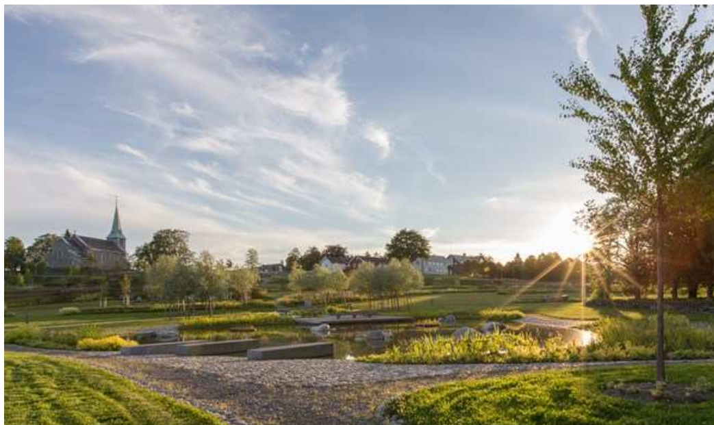
Havstein kirkegård.

Gravminne og gravutstyr må være i henhold til gjeldende vedtekter for Trondheim kommunes gravplasser.