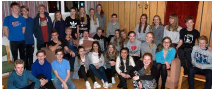
Konfirmanter Lade 2015-16