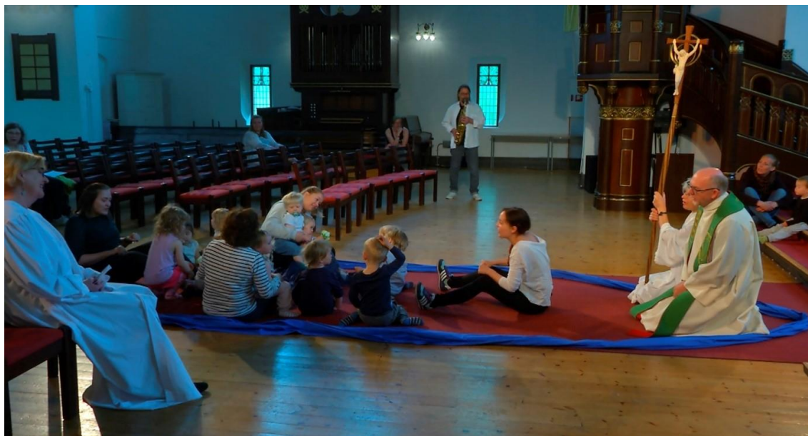
Vi er i samme båt