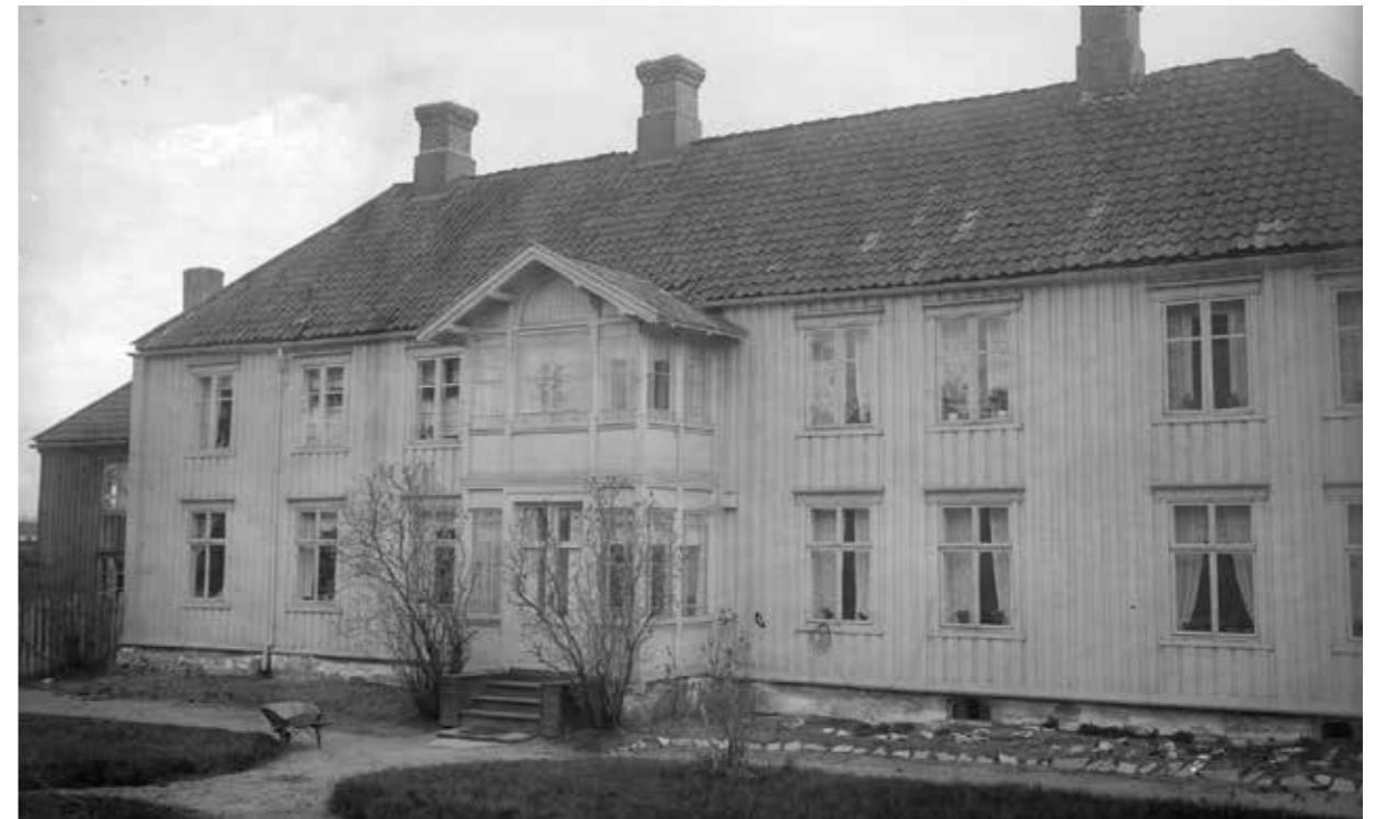
Hovedbygningen på Voldsminde gård. 1935. Den hadde gårdsnummer 9/6 og var opprinnelig en parsell av Rønningen. Den stod på den nåværende adressen Innherredsveien 82. Hovedbygningen ble revet 1958.

Tingstua på Lademoen som altså er eldre enn Strinda kommune, var lokale for det lokale ting eller rettssamling. I dag har det norske rettsapparatet også tre trinn med Høyesterett i Oslo, Lagmannsretten i Trondheim og den lokale