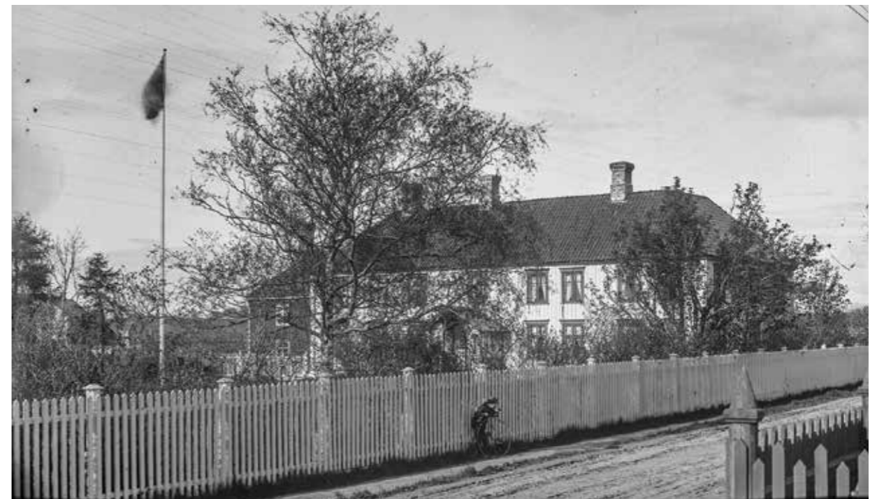
Innherredsveien med Voldsminde gård. Bildet tatt ca. 1895.

tingretten. Det vil si at vi nå har Høyesterett i Oslo på toppen, Vi har 6 lagmannsretter og 63 tingretter. Hver kommune har altså ikke lenger sin egen tingrett fordi hele landet er inndelt i 63