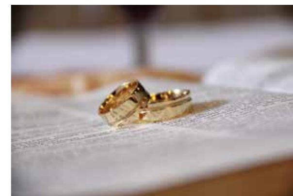
Drive in-vigsel: Alle som måtte ønske det, er hjertelig velkommen til drive in-vigsel i Lademoen kirke.

Siden Lademoen kirke for første gang tilbød drive in-vigsel, har nærmere 60 par i alderen 20 til 80 år benyttet seg av muligheten.